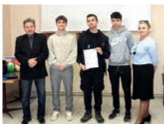
Powiat krosnieński – moja mała ojczyzna – strona 10

Z okazji Świąt Wielkanocnych, niosących odrodzenie życia, pragniemy złożyć najserdeczniejsze życzenia wszelkiej pomyślności i błogosławieństwa Chrystusa Zmartwychwstałego.