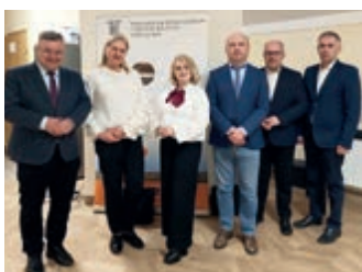
Spotkanie informacyjne na temat scalania gruntów – strona 6