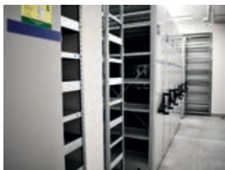
Modernizacja pomieszczeń na potrzeby archiwum zakładowego – strona 3