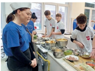
Hiszpania kontra Portugalia w Gastronomiki – strona 12