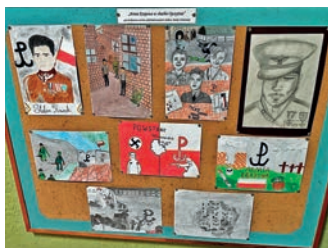
Święto Patrona Zespołu Szkół w Jedliczu – strona 6