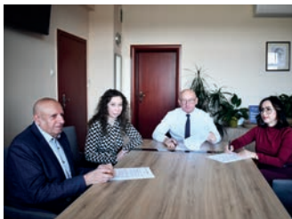
Inwestycja w przyszłość edukacji zawodowej – strona 4