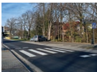
W Lubatówce kolejny odcinek drogi wyremontowany – strona 8