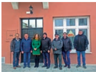
Zabytkowa kamienica w Dukli odzyskała dawny blask – strona 7