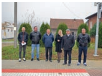
Nowy chodnik w Bratkówce. Będzie bezpieczniej! – strona 8