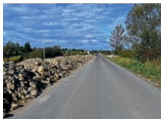
Inwestycje drogowe w toku – strona 4