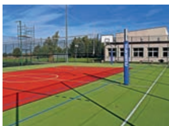
Modernizacja boiska przy ZS w Iwoniczu – strona 5