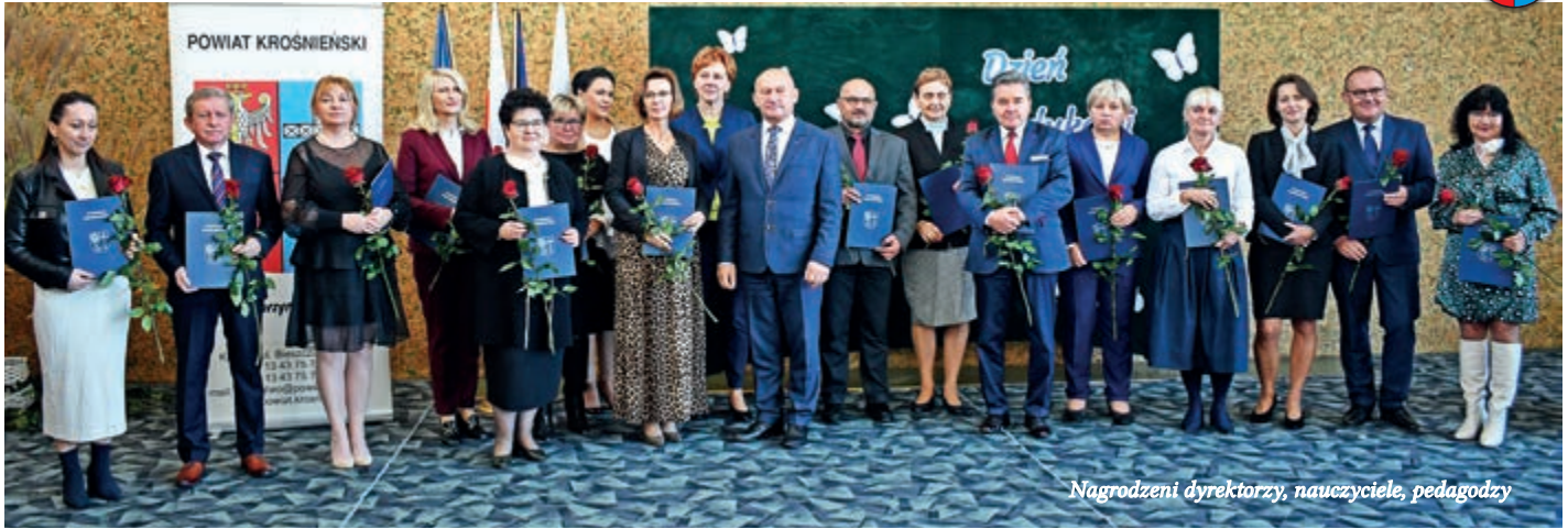
Nagrodzeni dyrektorzy, nauczyciele, pedagodzy