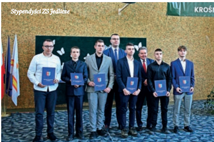
Stypendyści ZS Jedlicze