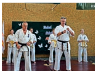
Święto Sportu – strona 14