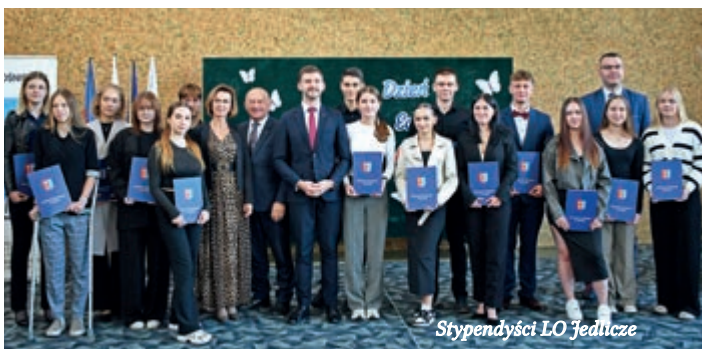
Stypendyści LO Jedlicze