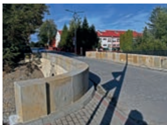
Roboty konserwatorskiej przy moście w Iwoniczu – strona 3