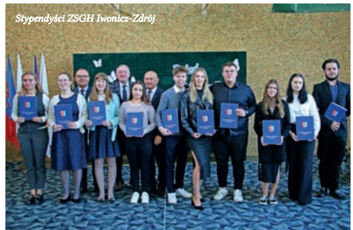
Stypendyści ZSGH Iwonicz-Zdrój