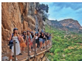
Wyprawa „W poszukiwaniu smaku” – strona 12