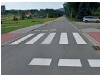
Przebudowa drogi powiatowej Iwla – Polany – Huta Polańska zakończona – strona 4