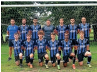
Nafta – Splast Jedlicze zwyciężca Turnieju o Puchar Starosty – strona 6