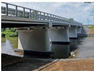
Most w Łązkach Jagiellońskich po przebudowie – strona 3