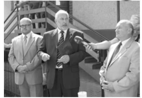
Negocjacje ze związkowcami