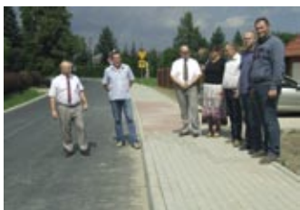
Zakończona inwestycja w gminie Miejsce Piastowe – strona 7