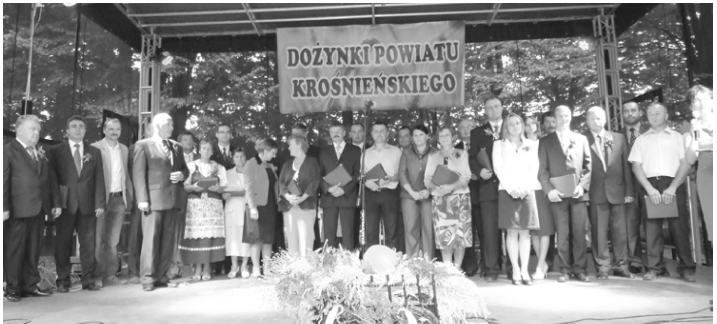
Zasłużeni rolnicy z powiatu krośnieńskiego

Następnie barwny korowód prowadzony przez kapelę „Rymanowianie” z udziałem delegacji wieńcowych reprezentujących wszystkie gminy powiatu krośnieńskiego oraz zaproszonych gości przeszedł do Parku Rymanowskiego, gdzie zorganizowano dalszą część obchodów.