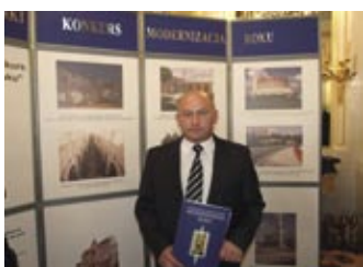
Wyróżniony zabytkowy most w Iwonicy – strona 16