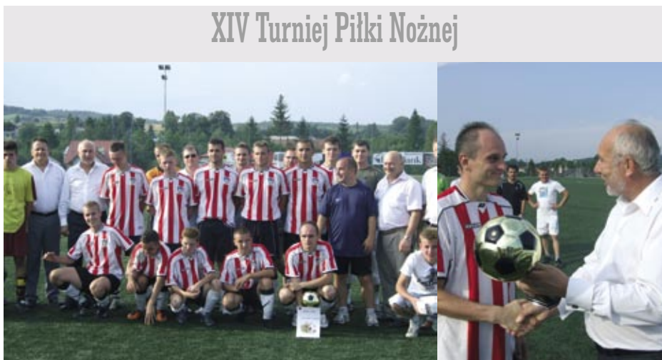
XIV Turniej Piłki Nożnej

Starostwo Powiatowe w Krośnie Gmina Dukła MOSiR Dukła