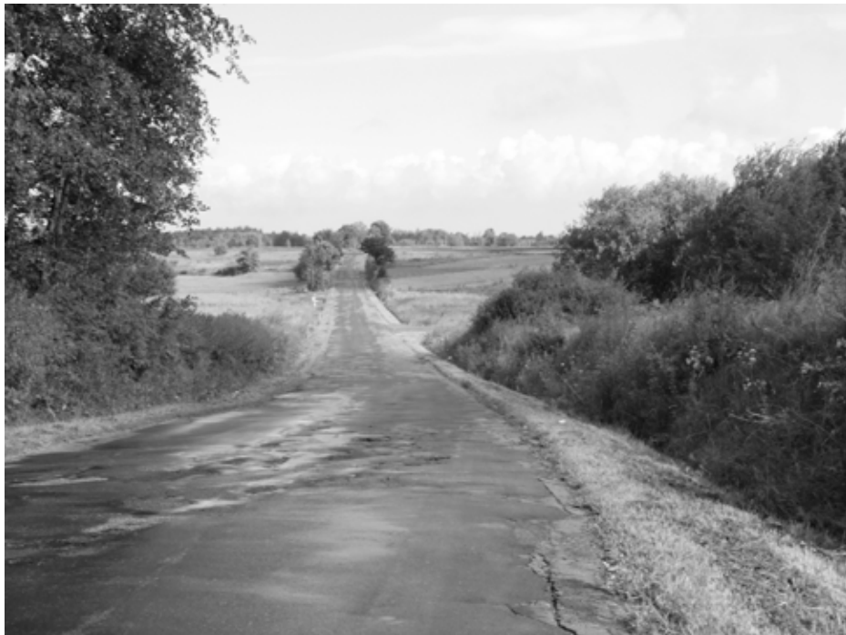
Zniszczona droga w Wietrznie zostanie odbudowana

– Realizacja inwestycji zwiększy bezpieczeństwo kierowców i pieszych, zmniejszy się eksploatacja pojazdów, skróci czas po-