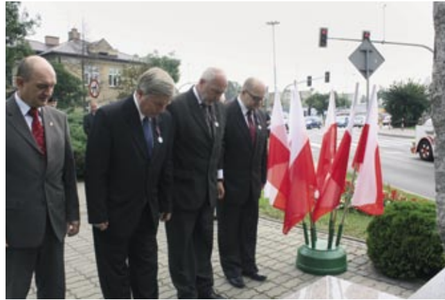
Władze powiatu i miasta Krosna pod pomnikiem poległych w walce z faszyzmem

Wrześniowe spotkanie jest czasem wspomnień, którym żołnierze i weterani chętnie się dzielą. Opowiadają o wydarzeniach z 1939 r., latach okupacji i trudach wojennych. Opowieści te są bezcennym dziedzictwem.