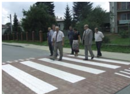
Wyniesione przejście dla pieszych w Głowience

– Droga Krosno – Rogi – Iwonicz jest elementem infrastruktury drogowej powiatu krośnieńskiego i gminy Miejsce Piastowe. Stanowi ważne i dogodne połączenie miasta Krosna z miejscowościami Głowienka, Wrocanka, Rogi, Miejsce Piastowe. Jest także łącznikiem z międzynarodową „dziewiątką” Radom – Barwinek oraz drogą krajową nr 28 Zator – Wadowice – Przemyśl – Medyka – Granica Państwa. Może służyć jako droga strategiczna i objazdowa w czasie prowadzonych remontów, ograniczeń lub