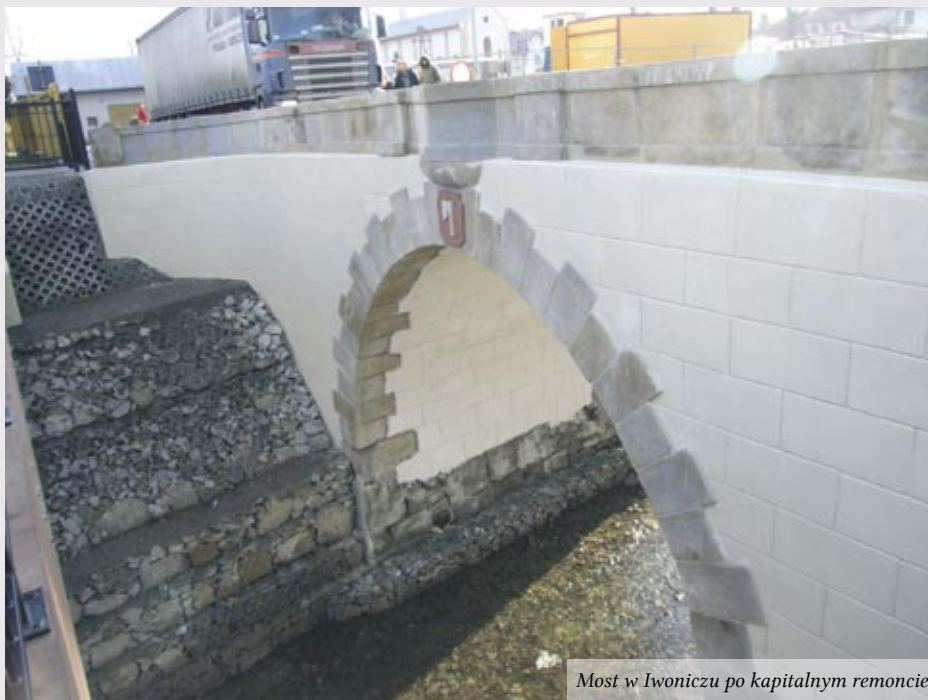
Most w Iwoniczu po kapitalnym remoncie

Jednoprzęsłowy most o konstrukcji łukowej stanowi unikatowy zabytek sztuki