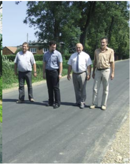
...i po remoncie