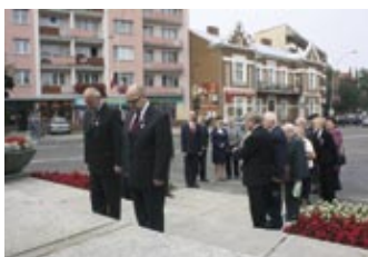
Uczczono Dzień Weterana – strona 15