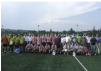
Turniej o Puchar Starosty – strona 8