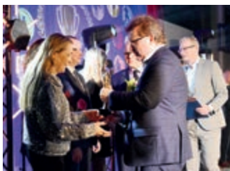
Powiatowe święto sportu – strona 7