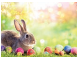
Konkurs na „KARTKĘ WIELKANOCNĄ” – strona 14