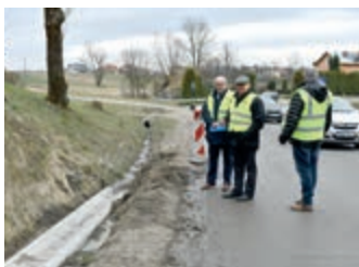
Środki PPGR wykorzystane na terenie Powiatu – strona 3