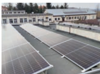
Powiat stawia na „Zieloną energię” – strona 16