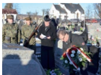
Inauguracja obchodów Roku Ignacego Łukasiewicza – strona 5