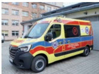
Krośnieńskie pogotowie ma nową karetkę – strona 3