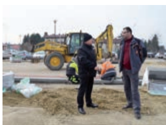
Będzie więcej miejsc parkingowych przy Starostwie Powiatowym w Krośnie – strona 3