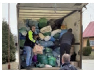
Powiatowe Magazyny Pomocy – strona 15