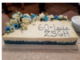
Diamentowy Jubileusz „Iwoniczkiego Gastronomika” – strona 10

Z okazji Świąt Bożego Narodzenia składamy najserdeczniejsze życzenia zdrowia, wszelkiej pomyślności i spokoju.