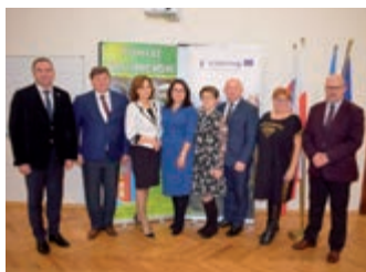
Podsumowanie mikroprojektu polsko-słowackiego – strona 4