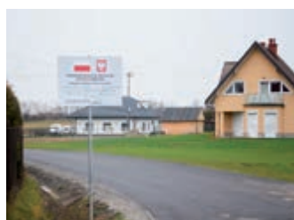
Droga Dobieszyn – Świerzowa Polska po remoncie – strona 8