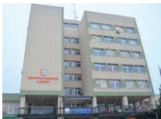
Odnowiony budynek Starostwa Powiatowego w Krośnie – strona 5