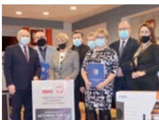
Szkoły powiatu mają nowy sprzęt komputerowy – strona 11