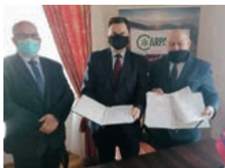
Promocja pogranicza polsko-słowackiego – strona 2