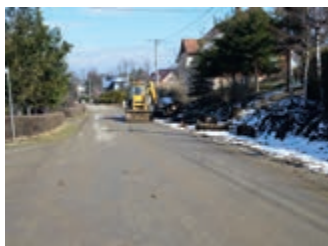
Trwają prace na drodze powiatowej w Klimkówe – strona 6