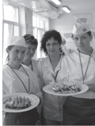
Zwycięzki zespół z ZSGH