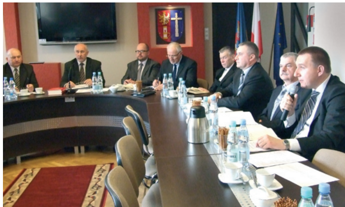
Spotkanie w starostwie