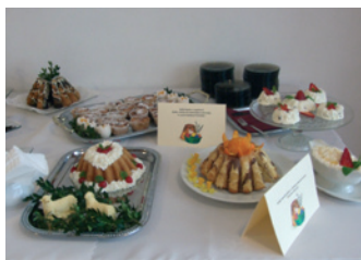
Najsprawniejsi kucharze i cukiernicy w Iwoniczu-Zdroju – strona 6