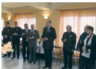
164. rocznica Wiosny Ludów w Budapeszcie – strona 11