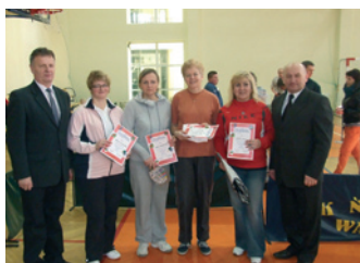
Dukla – powiatową stolicą tenisa stołowego – strona 10