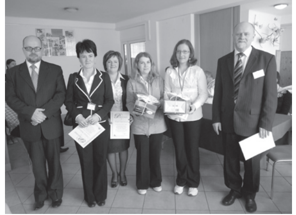
Laureatki III miejsca

30 MARCA 2012 R. W ZSGH W IWONICZU-ZDROJU ODBYŁ SIĘ FINAŁ IX WOJEWÓDZKIEGO KONKURSU „NAJSPRAWNIEJSZY W ZAWODZIE KUCHARZ”.