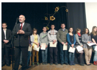
Żyj zdrowo i kolorowo – strona 12