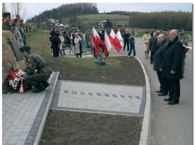
(fot. Damian Krzanowski)