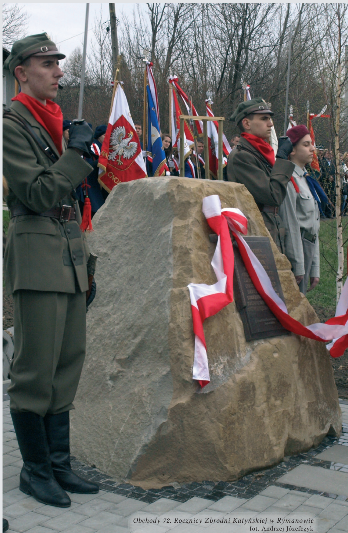
Obchody 72. Rocznicy Zbrodni Katyńskiej w Rymanowie