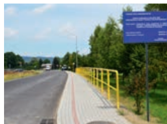
Mieszkańcy Korczyny mają przebudowaną drogę – s. 3