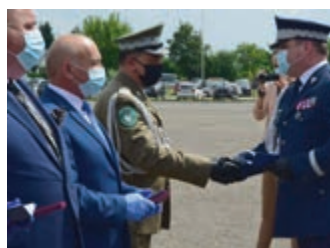
Starosta Krośnieński uhonorowany Medalem Za Zasługi dla Policji – s. 16