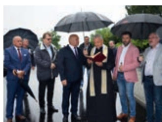
Droga Milcza – Besko po przebudowie – s. 5