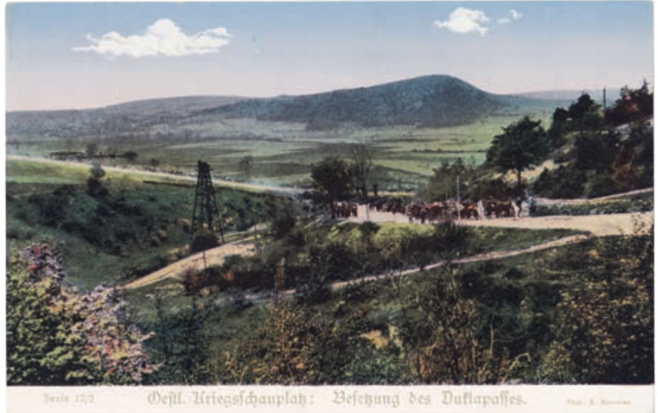
Kolumna wojsk pruskich w okolicach Dukli (Równe- Biała Góra) w maju 1915 roku. Pocztaówka podkolorowana, fot. R. Sennecke, wyd. Kriershilfe, z cyklu „Gloria-Viktoria-Album”. Ze zbiorów Muzeum Historycznego – Pałac w Dukli

W swoim wystąpieniu przybliżył dramatyczne wydarzenia z okresu I wojny światowej, dokładne daty, miejsca walk w Beskidzie Niskim, głównie w rejonie Przełęczy Dukielskiej, w oparciu o nieznane archiwalia rosyjskie. Rosjanom zależało na zajęciu terenów Galicji, zdobyciu przełęczy, m.in. Łupkowskiej i Dukielskiej otwierających drogę na południe, w głąb terytorium Austro-Węgier. Na terenie Beskidu Niskiego od września 1914 do maja 1915 roku kilkakrotnie zmieniały się pozycje walczących, wiązało się to również z próbami odblokowania przez wojska Austro-Węgier twierdzy Przemyśl. Prowadzenie w tym górzystym terenie „walk za wszelką cenę”, w siarczyste mrozy, przy głębokim śniegu, powodowało trudności w przenoszeniu broni, zaopatrzenia, jak również choroby, odmrożenia i zamarznięcia, w konsekwencji doprowadziło do bardzo wysokich strat po obu stronach. Straty austro-węgierskie