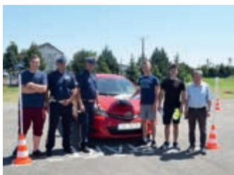
ZS w Iwoniczu Mistrzem Polski – strona 4