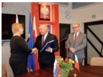
Współpraca między szkołami – strona 5