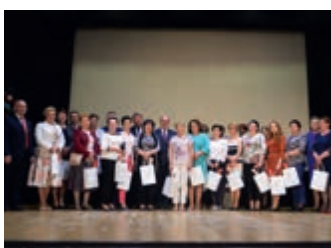
Powiatowy Dzień Matki – strona 8-9