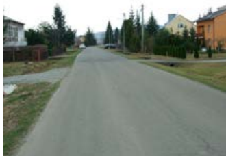
Powiat składa wniosek na przebudowę drogi – strona 3