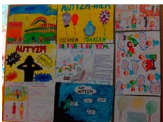
Dukielskie Dni Świadomości Autyzmu – strona 6