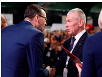
Święto Sołtysów – strona 4