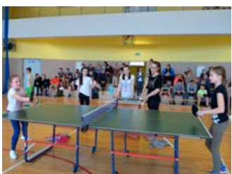
Powiatowa Olimpiada Tenisa Stołowego – strona 15