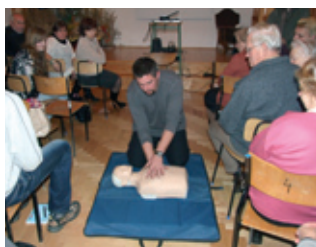
Edukacja zdrowotna w powiecie – strona 14