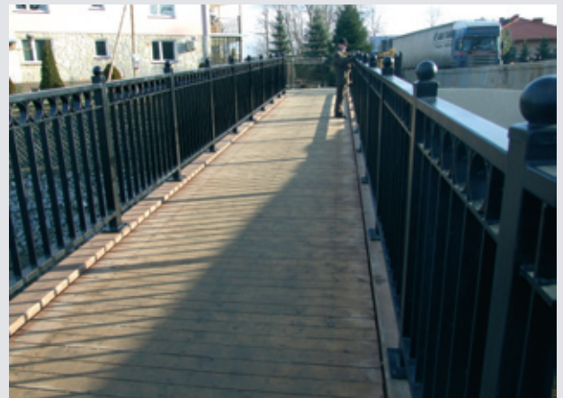
Nowa kładka dla pieszych