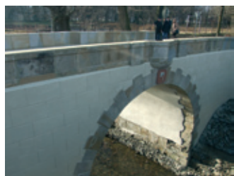
Most w Iwoniczu odrestaurowany, funkcyjny i bezpieczny – strona 16