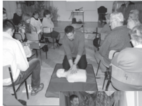
Pokaz udzielania pierwszej pomocy w LO w Jedliczu