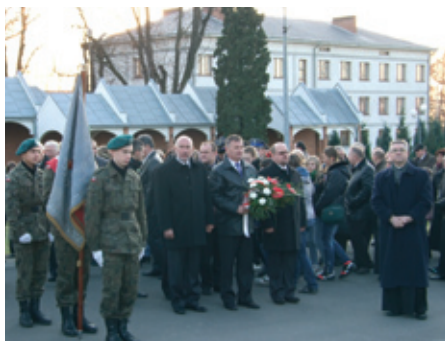
Uroczystości rocznicowe w Miejscu Piastowym

wracanie pamięcią do przeszłości, ale to także okazja aby każdy z nas uczynił szczególny rachunek sumienia, jak dzisiaj podchodzimy do naszej ojczyzny, czy utożsamiamy się z nią, czy mamy odwagę nazwać tę ziemię – matką.