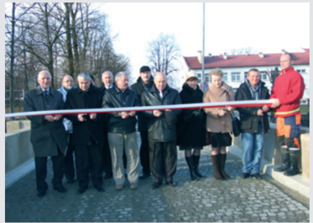
Symboliczne przecięcie wstęgi