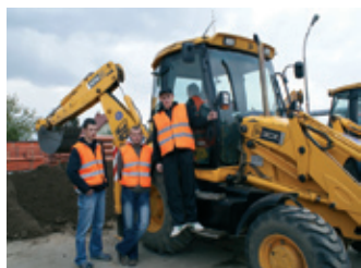
Podnoszenie kwalifikacji uczniów w ZS w Jedliczu – strona 9