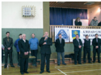
Międzynarodowa Siatkówka z „Pro-Familią” – strona 3