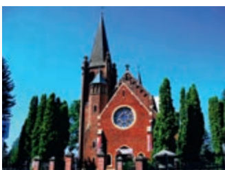
Powiat dotuje lokalne zabytki – strona 15