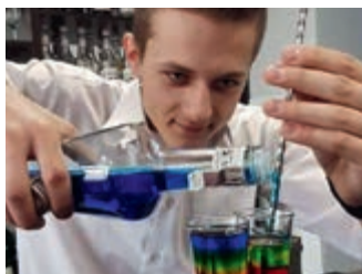
Aktywne ferie w iwonickim „Gastronomiku” – strona 13