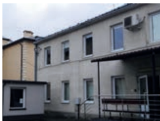
Termomodernizacja pogotowia – strona 4