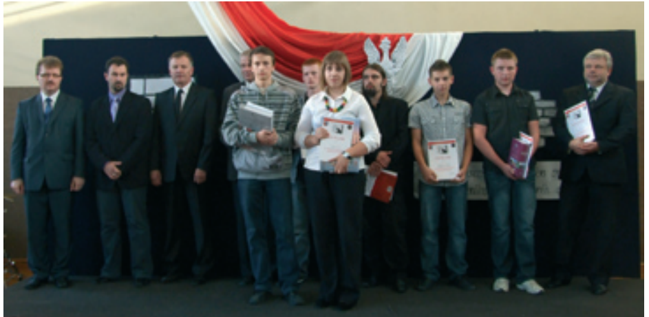
Laureaci konkursu Historii XX w.