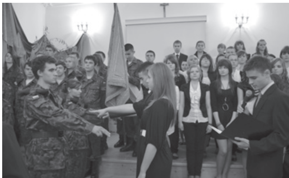
Uroczyste ślubowanie „pierwszaków”

nopnickiej. Wystąpienie wzbudziło ogromne zainteresowanie wśród słuchaczy. Było przykładem kunsztu retoryki i odważnego spojrzenia na dylematy w relacjach Bóg – człowiek bliskie każdemu z nas. Rozdanie nagród w konkursie „Jan Paweł II – papież modlitwy” zakończyło część oficjalną i goście oraz społeczność szkolna mogli zwiedzić