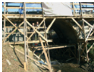
Remont mostu w Iwoniczu – strona 7