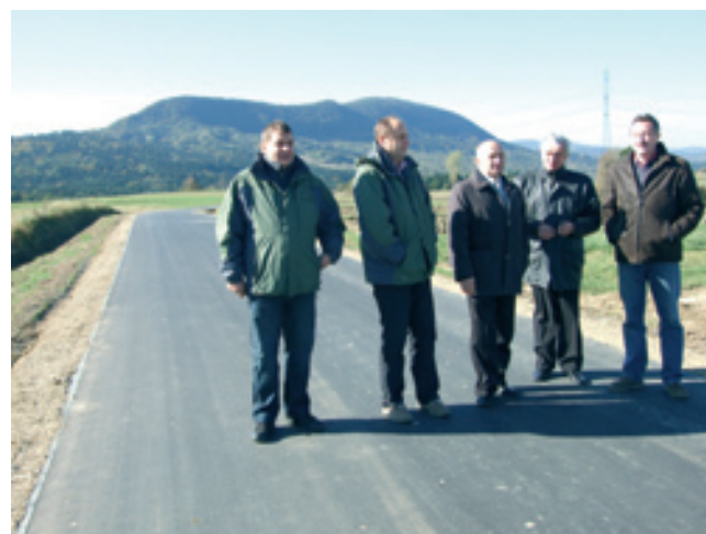
Wyremontowana droga w Lubatowej