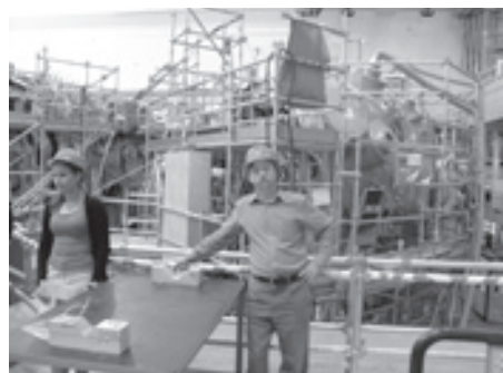
Stellarator Wendelstein 7-X w budowie