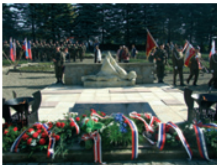
Cmentarz wojenny w Dukli