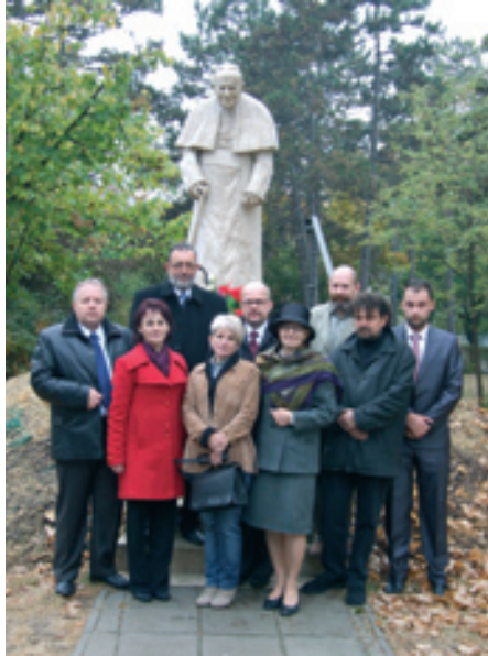
Delegacja powiatu krośnieńskiego pod pomnikiem bł. Jana Pawła II w Budapeszcie

Swoje prace prezentował na wystawach w: Warszawie, Rzeszowie, Krośnie, Jarosławiu, Łańcucie, Jaśle, Przemyślu, Iwoniczu-Zdroju.