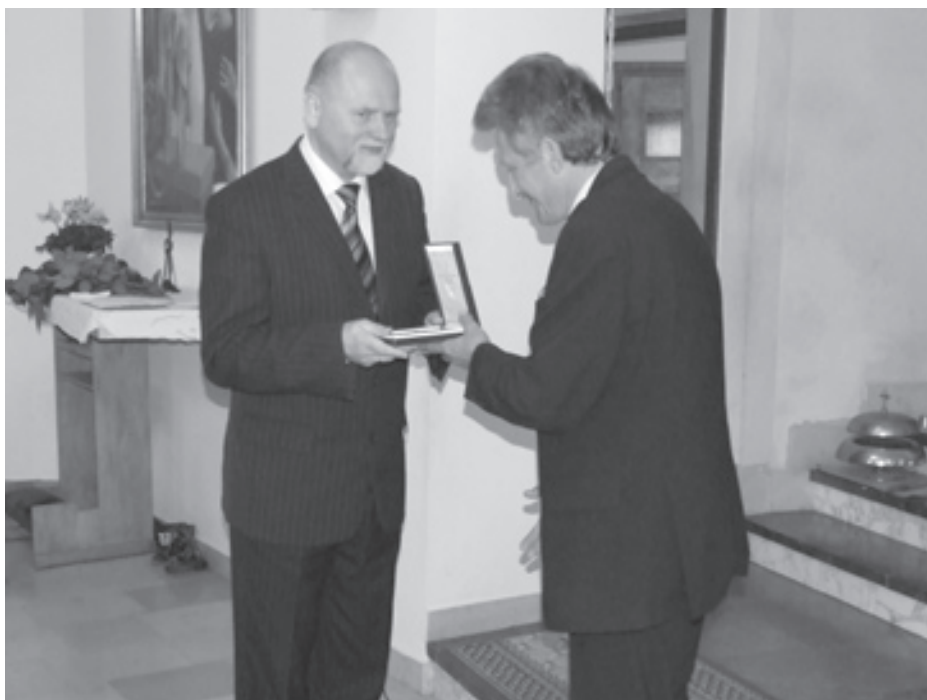
Poseł Stanisław Piotrowicz wręcza pamiątkowe godło Sentau RP

„Iwonickiego Gastronomika” została zapisana. Przed społecznością szkolną nowe wyzwania, praca i nauka. Życzymy, aby ich dokonania nie ustępowały osiągnięciom poprzedników. Wszak za 50 lat podsumują je na kolejnym jubileuszu.