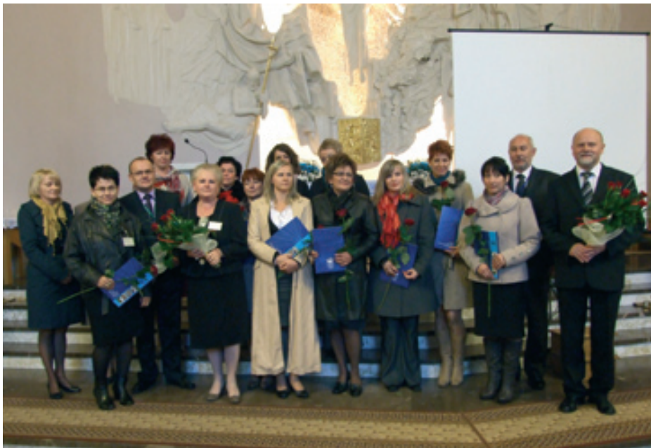
Wyróżnieni nauczyciele z przedstawicielami władz Powiatu Krośnieńskiego

50 LAT TO PIĘKNY WIEK. 15 PAŹDZIERNIKA 2011 R. W KOŚCIELE PARAFIALNYM W IWONICZU-ZDROJU SPOTKALI SIĘ PARLAMENTARZYŚCI, PRZEDSTAWICIELE WŁADZ POWIATU KROŚNIENSKIEGO, GMINY, RADNI, DYREKTORZY SZKÓŁ, NAUCZYCIELE, MŁODZIEŻ, RODZICE, ABSOLWENCI ORAZ PRZYJACIELE ABY WSPÓLNIE ŚWIĘTOWAĆ JUBILEUSZ ZESPOŁU SZKÓŁ GASTRONOMICZNO-HOTELARSKICH W IWONICZU-ZDROJU.