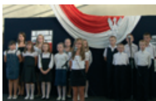
72. rocznica powstania Polskiego Państwa Podziemnego – strona 8