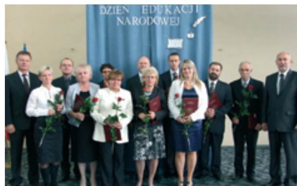
Nauczyciele wyróżnieni nagrodą Starosty