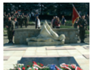
67. rocznica operacji karpacko-dukielskiej – strona 15