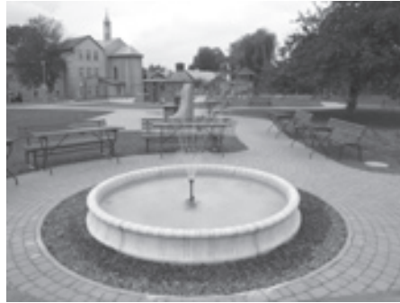
Ogród rekreacyjny ma powierzchnię pół hektara

Trafiają do niego niepełnosprawni intelektualnie chłopcy przed 18 rokiem życia. Część z nich pozostaje tutaj do końca swoich dni. Obecnie przebywa tutaj 80 osób niepełnosprawnych w stopniu znacznym i głębokim. Podopieczni traktują to miejsce jak swój dom, przebywają całą dobę