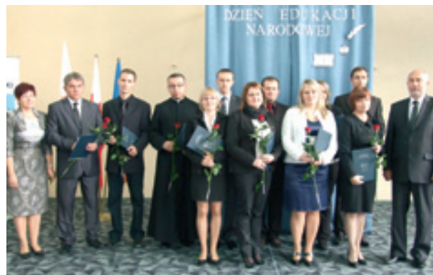
Nauczyciele, którzy uzyskali awans zawodowy