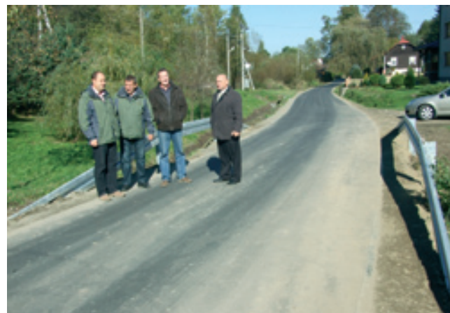
Odbiór drogi w Ustrobnej