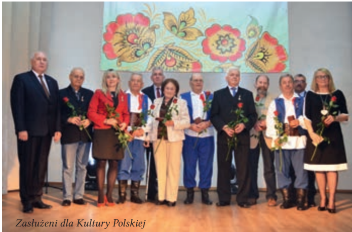
Zasłużeni dla Kultury Polskiej