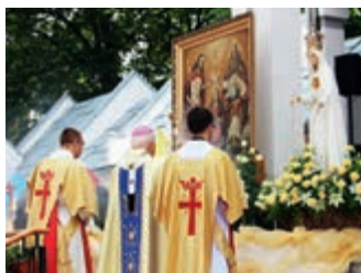
Podwójna koronacja wizerunku Maryi – strona 9