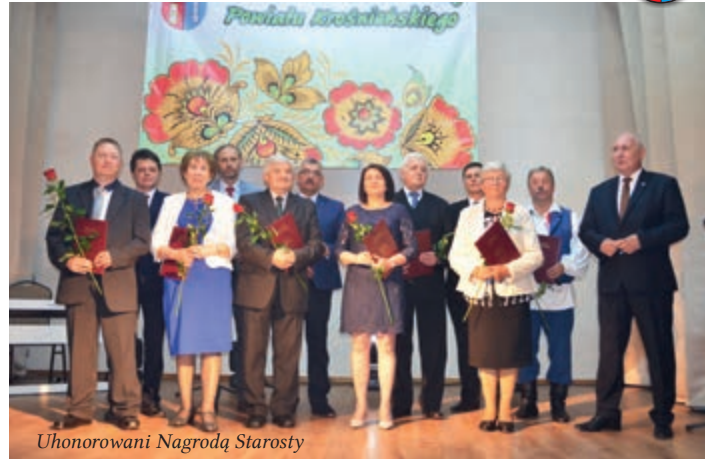
Uchonorowani Nagrodą Starosty