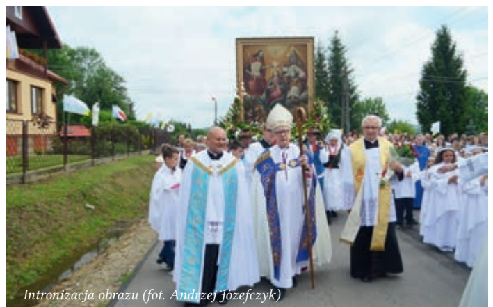
Intronizacja obrazu

11 czerwca br. w Sanktuarium św. Michała Archanioła i bł. Ks. Bronisława Markiewicza w Miejscu Piastowym odbyła się uroczystość ukoronowania Koronami Papieskimi dwóch wizerunków Maryi: Figury Matki Bożej Fatimskiej z Miejsca Piastowego, którą przy-