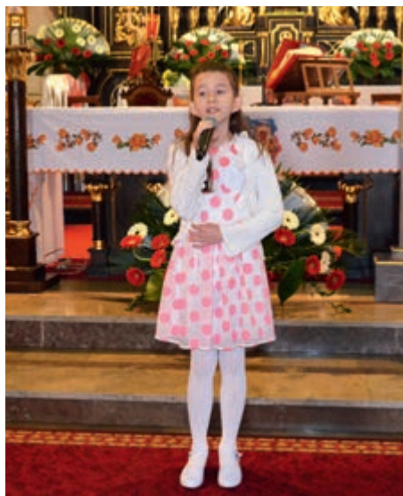
Laureaci konkursu „Śpiewajmy Świętym”