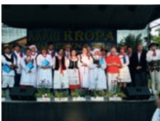
Przeгляд pieśni i muzyki ludowej Kropa – strona 16