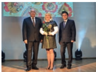
Działacze kultury mieli swoje święto – strona 3