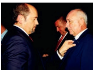
40 lat Okręgowego Związku Piłki Nożnej w Krośnie – strona 16