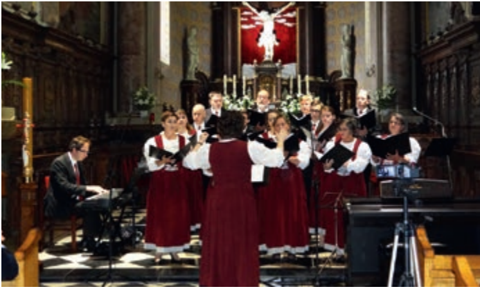
Chór węgierski „Rotudna”