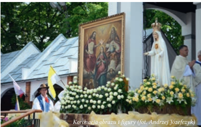
Koronacja obrazu i figury