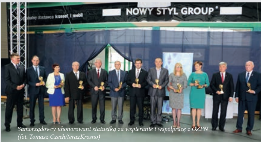
Samorządowcy uhonorowani statuetką za wspieranie i współpracę z OZPN

Podczas gali przypomniano największe sukcesy i najważniejsze wydarzenia. Na te-