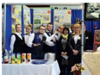
Targi edukacyjne dla gimnazjalistów – strona 6