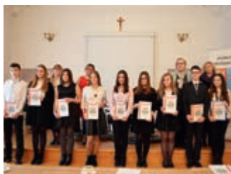
Recytowali poezję sybiracką – strona 3