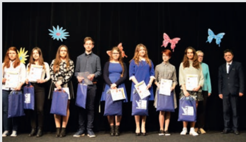
Laureaci konkursu literackiego

S TAROSTWO POWIATOWE W KROŚNIE WSPÓLNIE Z DYREKTORAMI SZKÓŁ PONADGIMNAZJALNYCH, KTÓRYCH ORGANEM PROWADZĄCYM JEST POWIAT KROŚNIEŃSKI, ZORGANIZOWAŁO PIKNIK ARTYSTYCZNY DLA GIMNAZJALISTÓW I UCZNIÓW SZKÓŁ PONADGIMNAZJALNYCH.