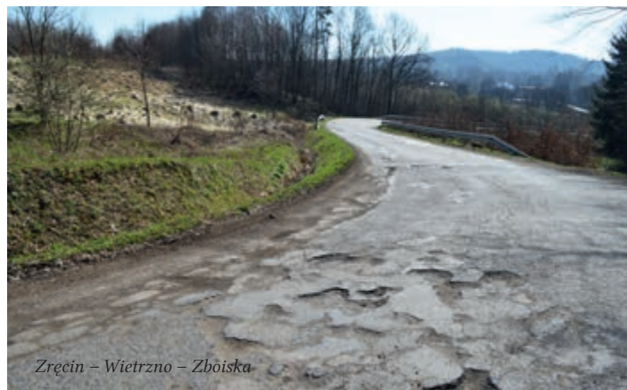
Zręcin – Wietrzno – Zboiska

P OWIAT KROŚNIEŃSKI ROZPOCZĄŁ REALIZACJĘ TRZECH GŁÓWNYCH ZADAŃ ZWIĄZANYCH Z PRZEBUDOWĄ DRÓG, NA KTÓRE OTRZYMAŁ DOFINANSOWANIE ZE ŚRODKÓW ZEWNĘTRZNYCH.