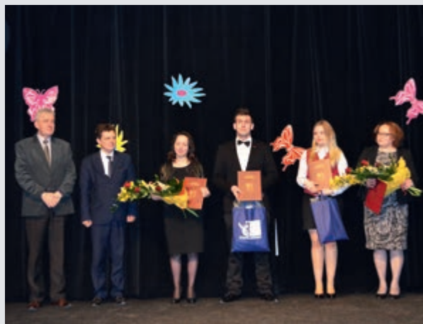
Nagrodzeni uczniowie z opiekunami i przedstawicielami powiatu