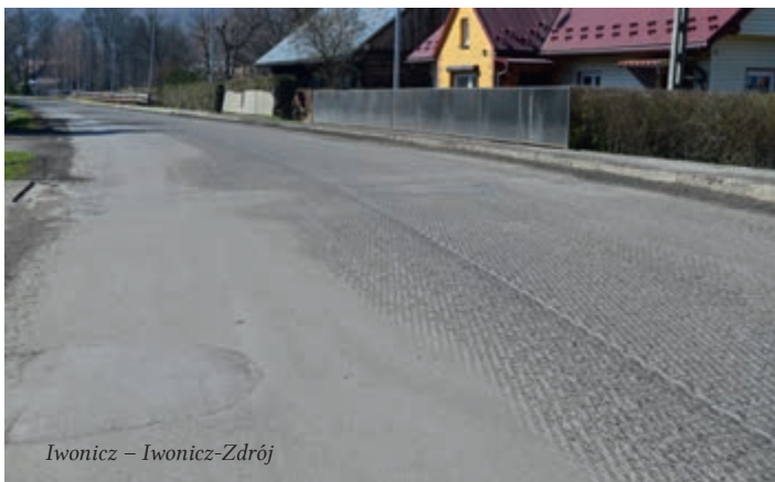
Iwonicz – Iwonicz-Zdrój