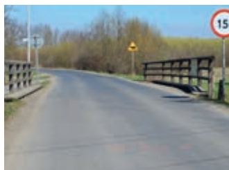
Inwestycje na drogach Powiatu w 2017 r. – strona 4