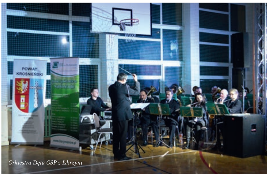
Orkiestra Dęta OSP z Iskrzyni