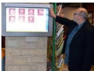
Elektroniczna Tablica Ogłoszeń – strona 15