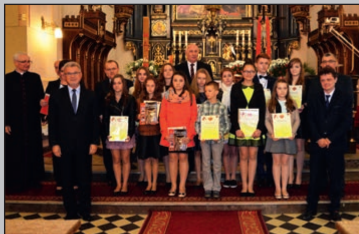
Aktywnie uczestniczył w imprezach organizowanych przez powiat