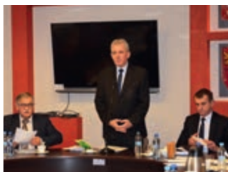
Nowy przewodniczący Rady Powiatu – strona 3