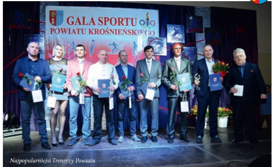
Najpopularniejsi Trenerzy Powiatu