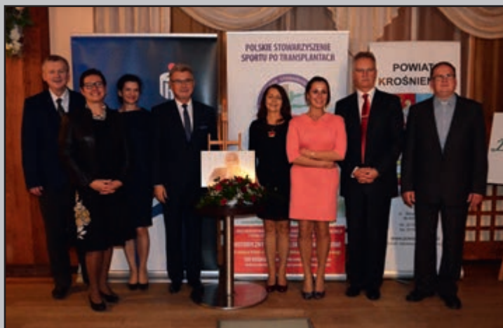
Był inicjatorem konferencji „Życie z życia”

Urna z prochami zmarłego spoczęła na cmentarzu parafialnym w Jaszczwi.