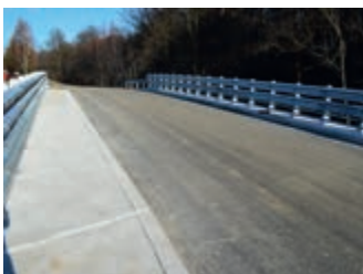
Trzy nowe mosty w ciągu drogi Sulistrowa – Draganowa – Głojsce – strona 6