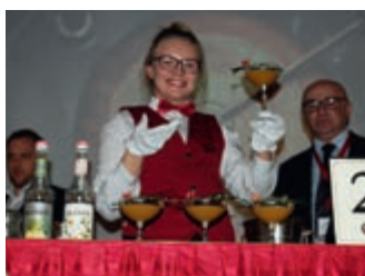
Wielki sukces barmański uczniów z ZSGH w Iwoniczu-Zdroju – strona 10