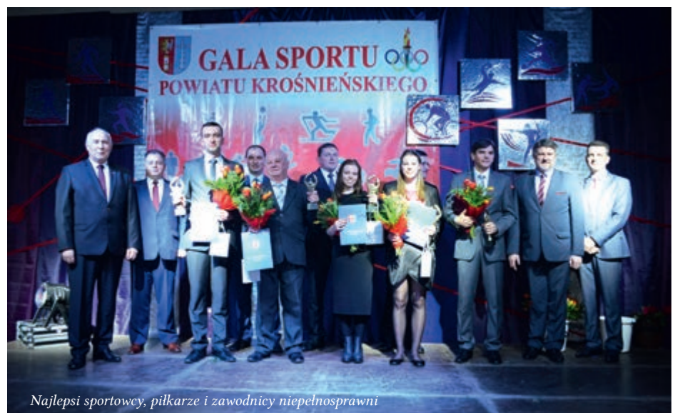
Najlepsi sportowcy, piłkarze i zawodnicy niepełnosprawni