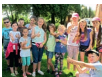
Michayland pielgrzymka dzieci do Miejsca Piastowego – strona 15