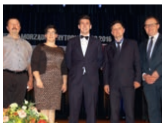
Nagroda Podkarpackiego Stowarzyszenia Samorządów Terytorialnych – strona 10