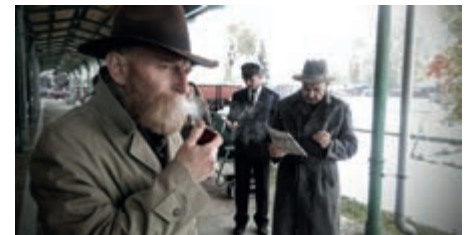
Kadr z filmu