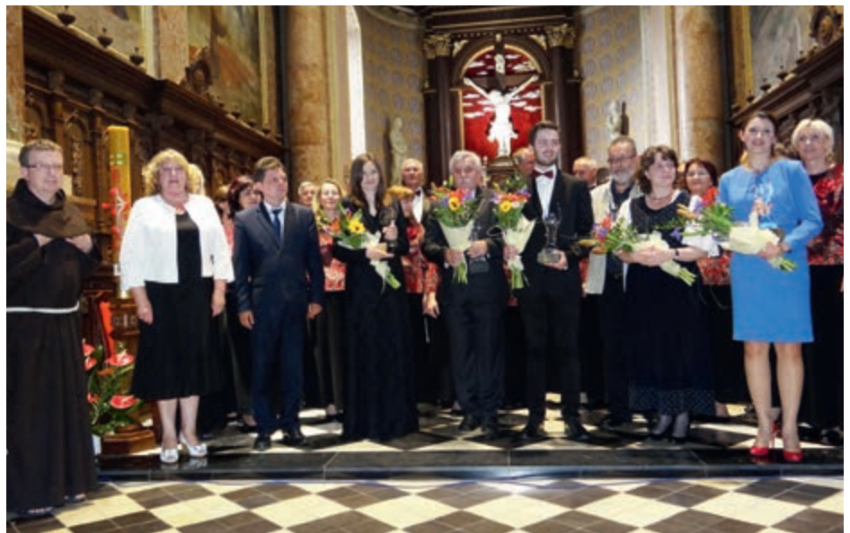
Dyrygenci i kierownicy chórów

Dni Młodzieży wraz z zaproszeniem Ojca św. Franciszka na zbliżające się wydarzenie do Krakowa.