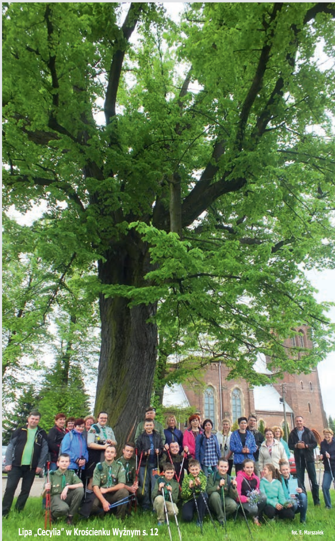
Lipa „Cecylia” w Krościenku Wyżnym s. 12