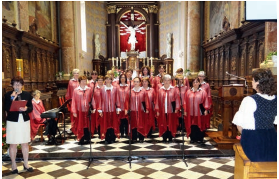
Chór z Budapesztu

Przez cały czas trwania koncertu zgro- madzeni mogli obejrzeć prezentację mul- timediálną na temat historii Świątowych