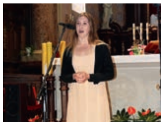
Międzynarodowy Przegląd Chórów w Dukli – strona 9