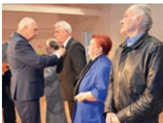
Powiatowe Święto Ludzi Kultury – strona 8