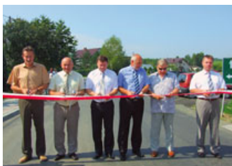
Wielomilionowa inwestycja w Gminie Jedlicze – strona 9