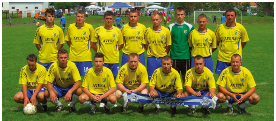
II miejsce – „Polonia” Kopytowa