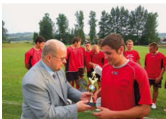
Turniej Piłki Nożnej o Puchar Starosty – strona 7