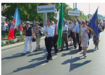
Spotkanie Miast z „Krzyżem” – strona 16