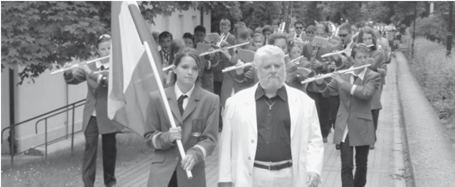
Orkiestra Dęta „Ami” z Budapesztu

P O RAZ JEDENASTY W RYMANOWIE-ZDROJU ODBYŁY SIĘ RYMANOWSKIE SPOTKANIA ORKIESTR DĘTYCH.