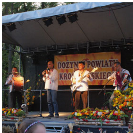
Zespół ukraiński „Na Drabini”

W trakcie eucharystii na ręce kapłana przekazano dary ofiarne. Na zakończenie ksiądz pobłogosławił wieńce i wiernych, którzy przybyli by wspólnie świętować i dziękować za tegoroczne plony.