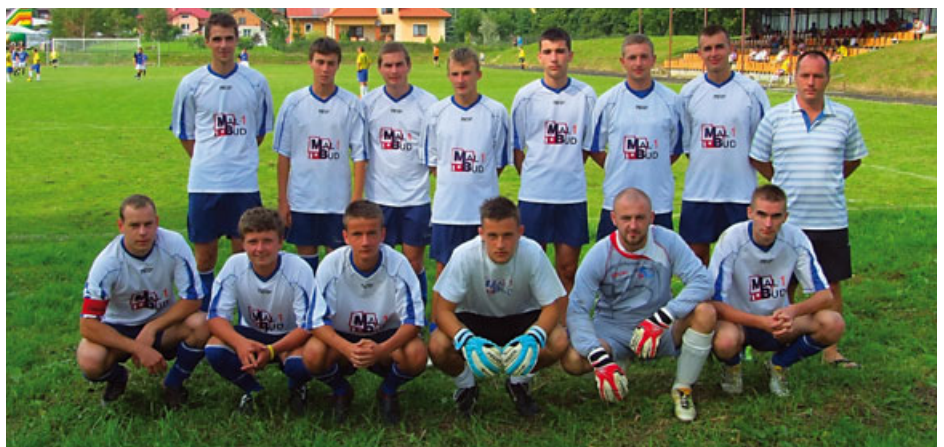
III miejsce – „Partyzant Mal-Bud I” Targowiska

Nożnej za wspaniałą obsługę sędziowską turnieju, oraz Pogotowiu Ratunkowemu w Krośnie za zabezpieczenie medyczne imprezy.