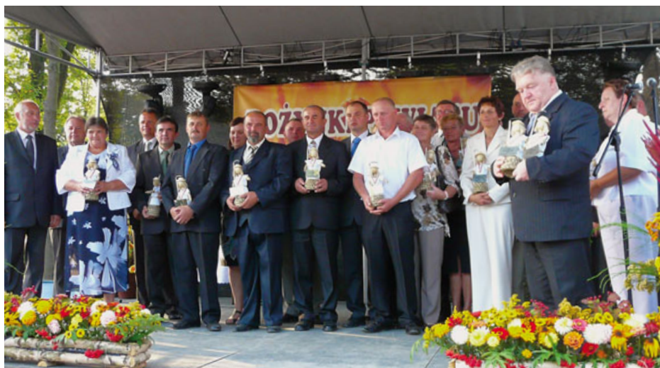
Zasłużeni rolnicy z powiatu z organizatorami