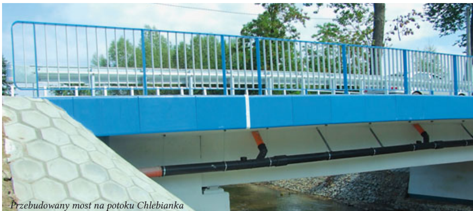
Przebudowany most na potoku Chlebianka