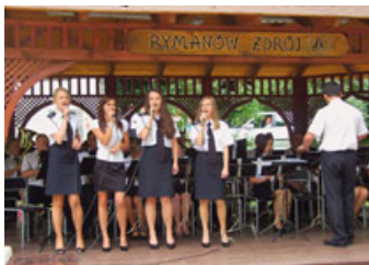
Przeгляд Orkiestr Dętych – strona 5