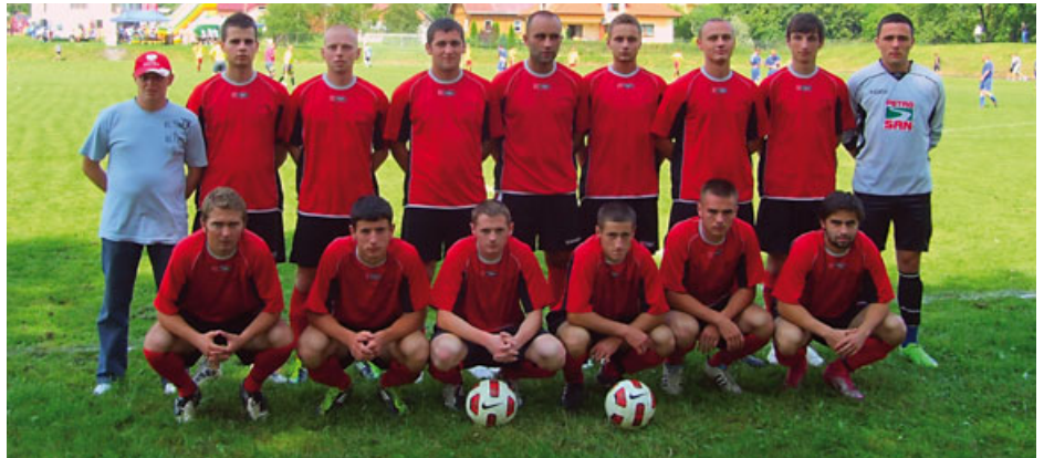
I miejsce – „Start” Rymanów