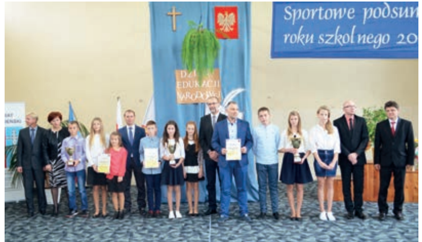
Igrzyska Młodzieży Szkolnej: