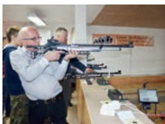
Spotkanie z Przewodniczącymi Rad zakończone strzelaniem – strona 10