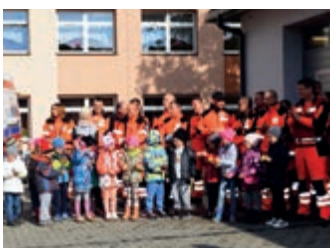
Święto Ratowników Medycznych – strona 15