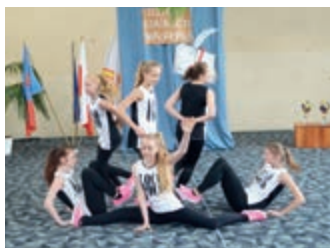
Podsumowanie sportu w powiecie krosńskim – strona 7