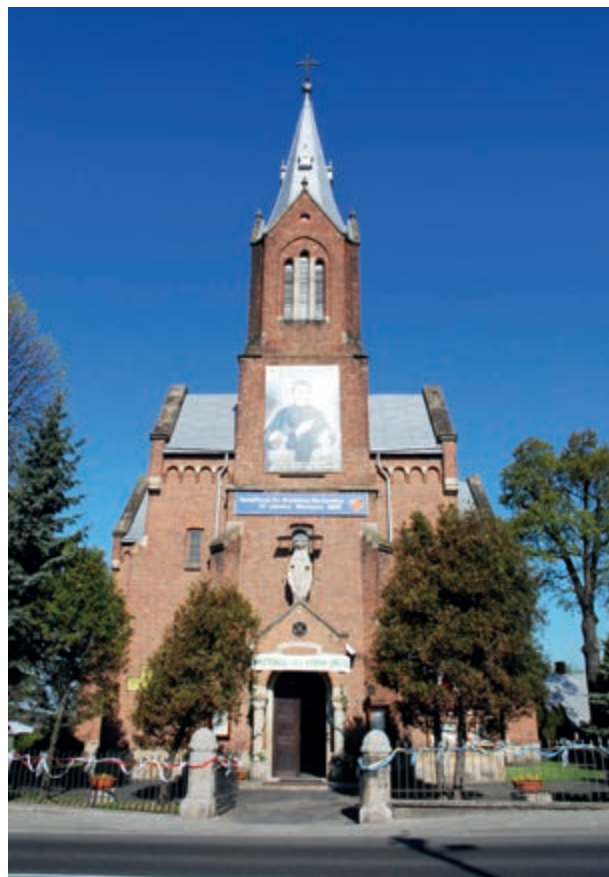
Miejsce Piastowe

Las targowicki graniczący z Zalesiem i Widaczem jest unikatowy, choćby z tego powodu, że na terenie mocno zurbanizowanych Dołów Jasielsko-Sanockich kompleksów leśnych zachowało się bardzo niewiele. Las ten kryje w sobie wiele ciekawych miejsc; można tam m.in. zobaczyć olbrzymią zaporę bobrową, unikatowy stuletni bluszcz wspinający się po olszy czarnej, czy najprawdopodobniej jedyny w krainie Dołów Jasielsko-Sanockich dziki drzewiasty ponad stuletni cis. Las zajmuje około 200-220 ha, a zarządza nim Nadleśnictwo Dukla.