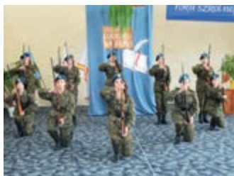
Powiatowe Święto Edukacji – strona 3