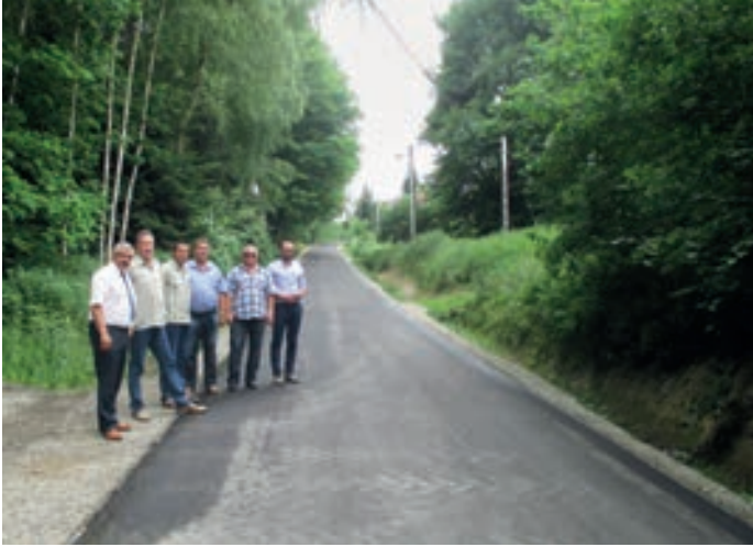
Przebudowana droga powiatowa Jaszczew – Ustrobna – Bratkówka