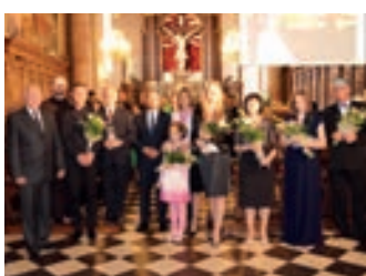
Międzynarodowy przegląd chórów – strona 9