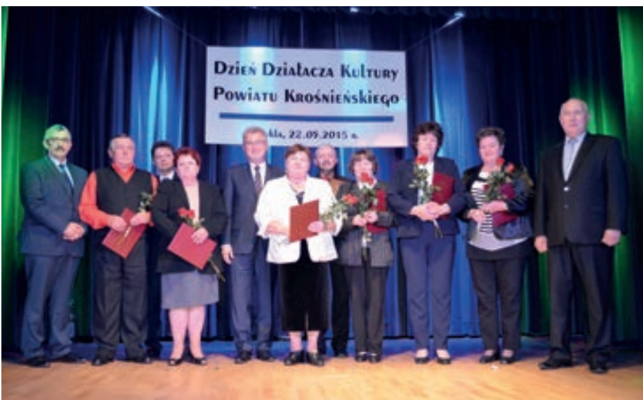
Nagrodzeni nagrodą Starosty Krośnieńskiego

przodków, do ich twórczości i do tego co stanowi o naszej tożsamości. Należy Wam się szacunek i życzenia, aby nigdy nie zabrakło życzliwych serc i osób, które będą Was wspierały w Waszej działalności. Za Waszą obecność, za Waszą twórczość bardzo dziękuję i pozostaję w nadziei, że kolejne pokolenia będą tworzyć polską kulturę, polską tradycję i tą krośnieńską ziemię upiększając swoją obecnością.