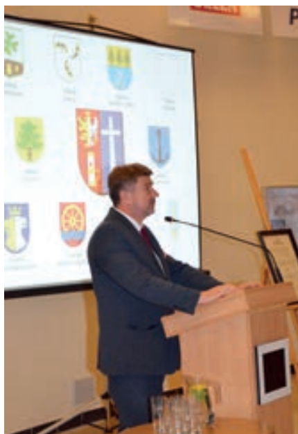
Posel RP Bogdan Rzońca