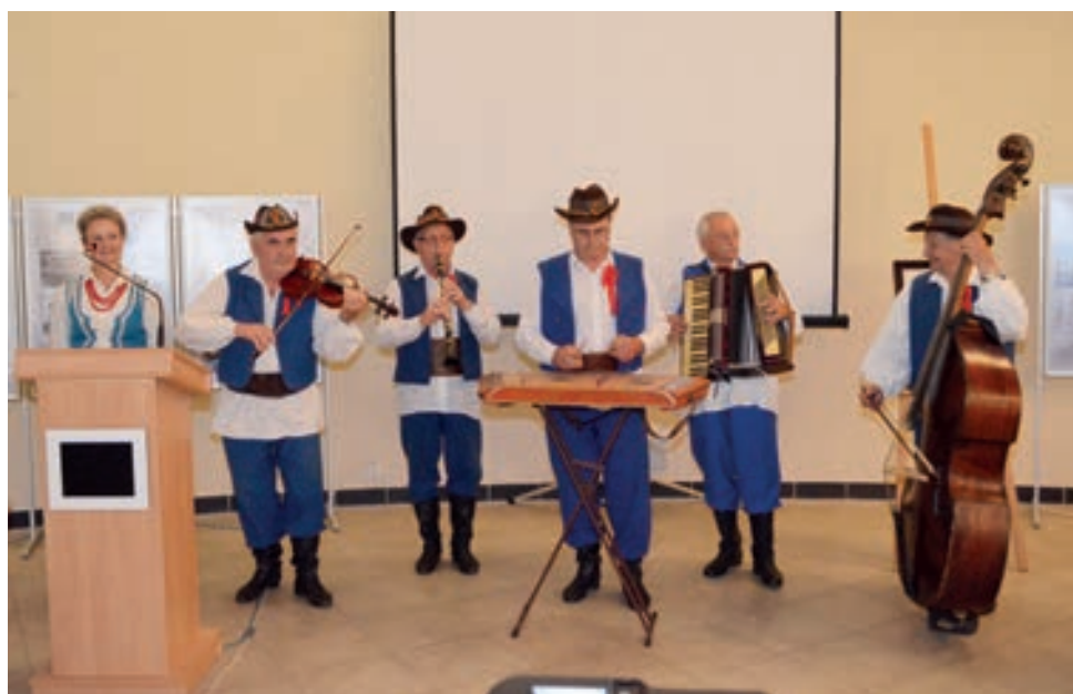
Kapela ludowa „Pogórzanie”