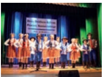
Nagrody dla ludzi kultury – strona 8