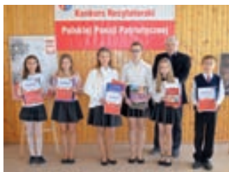
Recytują poezję patriotyczną – strona 7