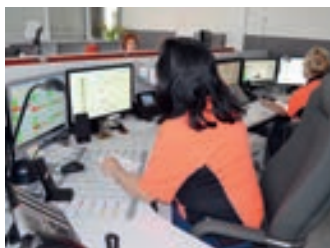
Skoncentrowana dyspozytornia medyczna już działa – strona 6