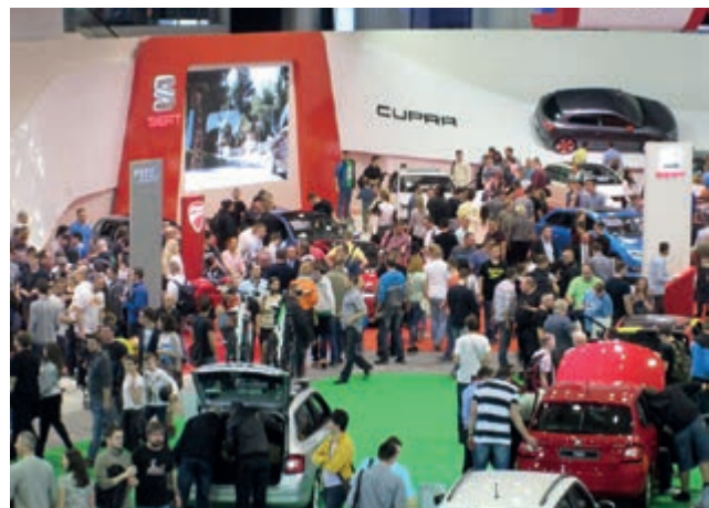
Uczniowie z ZS w Jedliczu na Międzynarodowych Targach Motoryzacyjnych w Poznaniu