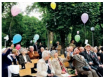
70-lecie LO im. M. Konopnickiej w Jedliczu – strona 3