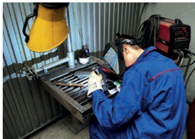
Kurs spawania metodą TIG w ZS w Iwoniczu