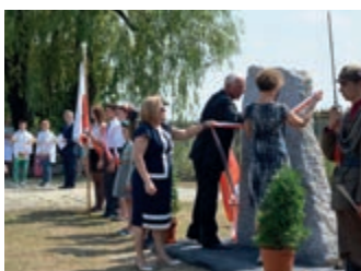
Wielką rzeczą jest wolność... – strona 16