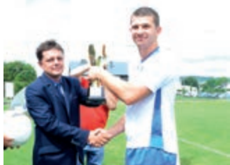
XVII Turniej o Puchar Starosty Krośnieńskiego – strona 10