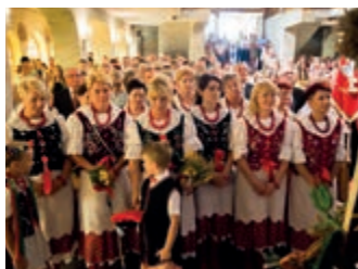
Obchody rocznicowe wsi Targowiska – strona 7