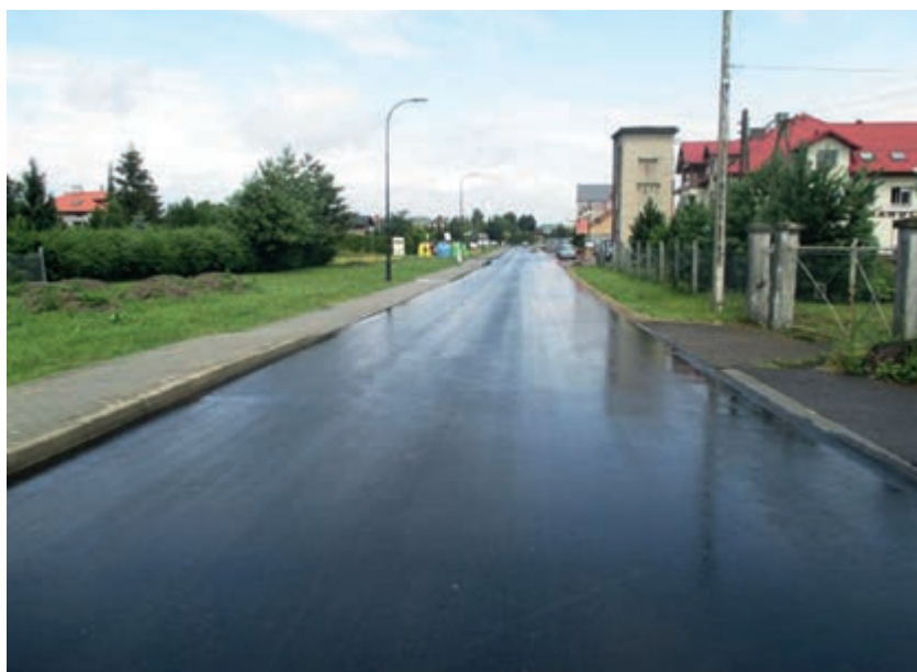
Przebudowana ul. Mitkowskiego

Powód do zadowolenia mają mieszkańcy Głowienki. Zakończyły się prace przy budowie chodnika na długości 200 m w ciągu drogi Krosno – Rogi – Iwonicz, łączącego Głowienkę z Krosnem. Dzięki inwestycji poprawi się bezpieczeństwo w tym niewralgicznym miejscu wsi, szczególnie dzieci uczęszczających do szkoły. Piesi i amatorzy nordic walking swobodnie i bezpiecznie będą mogli przemieszczać się w kierunku Krosna.