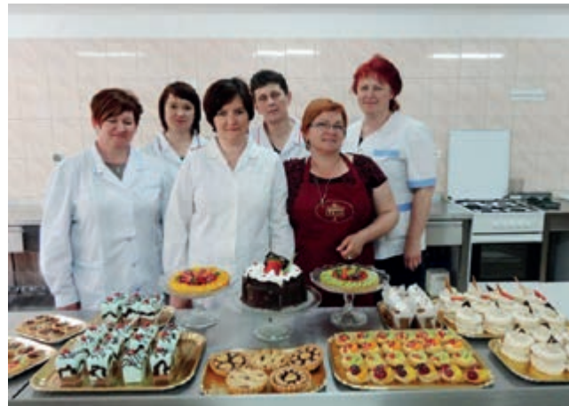
Młodzież i nauczyciele ZSGH w Iwoniczu-Zdroju na szkoleniu dot. organizacji pracy i optymalizacji wydajności