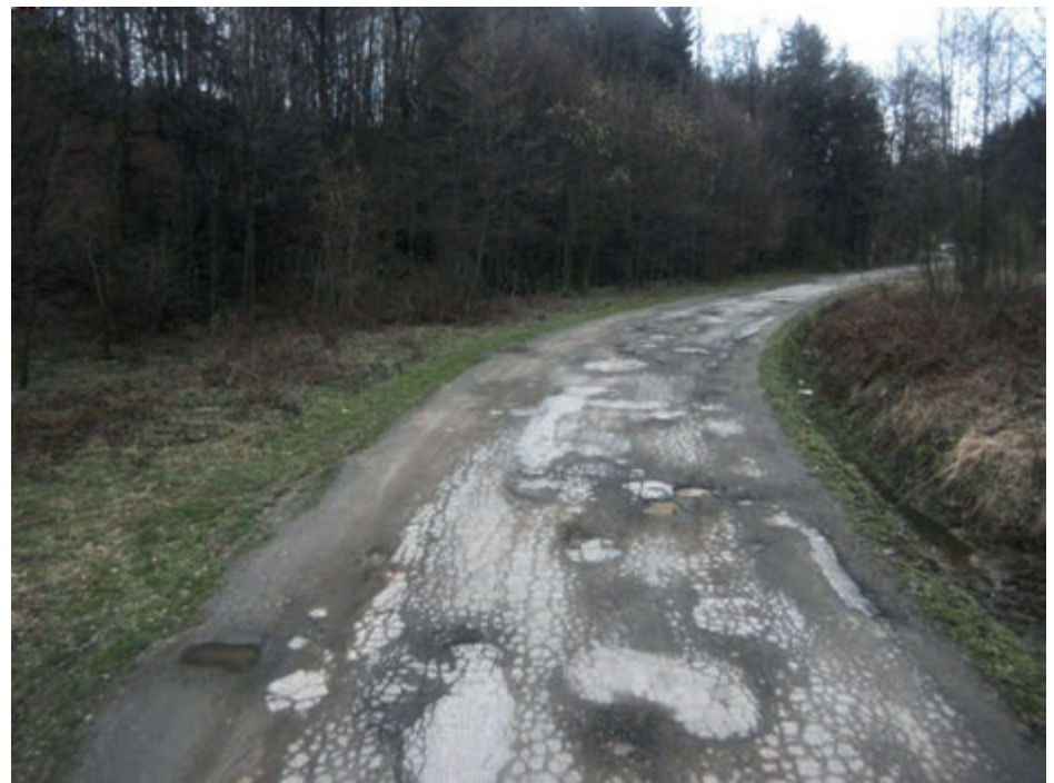
Droga Wola Jasienicka – Budy Komborskie, stan przed remontem

Wymienione inwestycje realizowane są przy wsparciu finansowym gmin i wspomnianego już Nadleśnictwa Dukla.