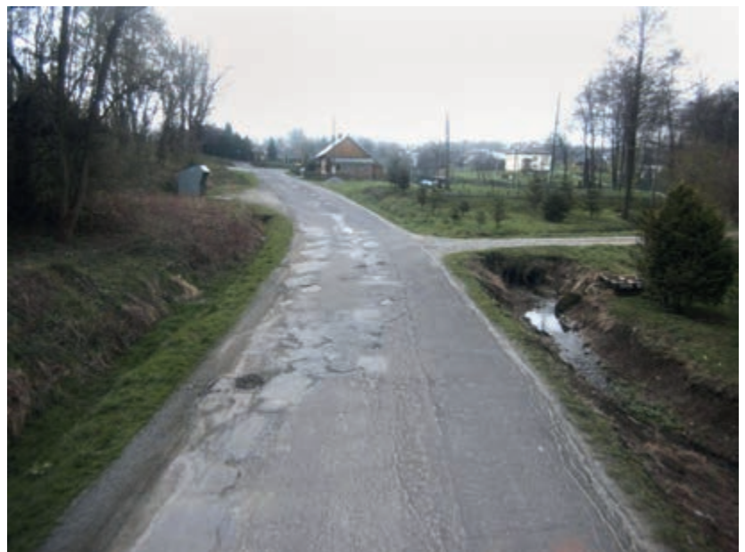
Droga Chorkówka – Faliszówka – Nienaszów zostanie wyremontowana ze środków powodziowych

Jest to druga w tym roku transza przyznana dla powiatu krośnieńskiego.