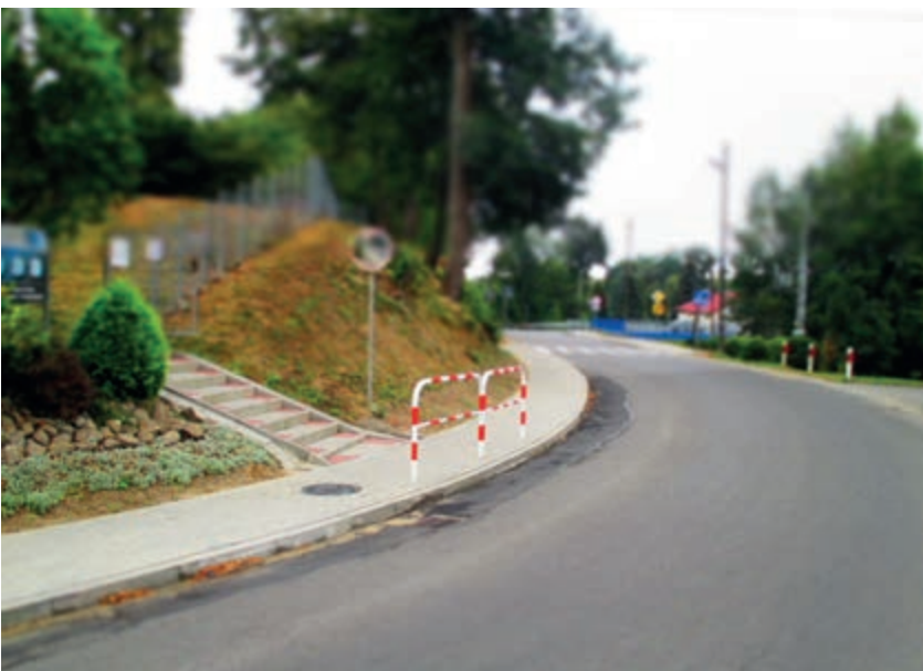
Nowy chodnik w Głowience