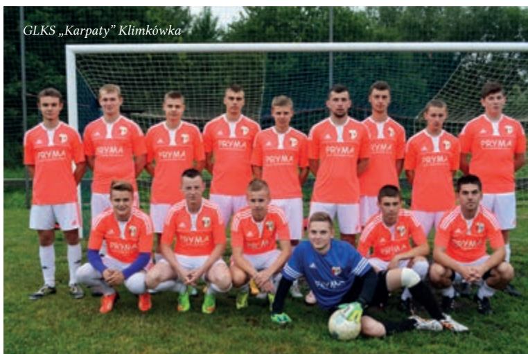
GLKS „Karpaty” Klimkówka