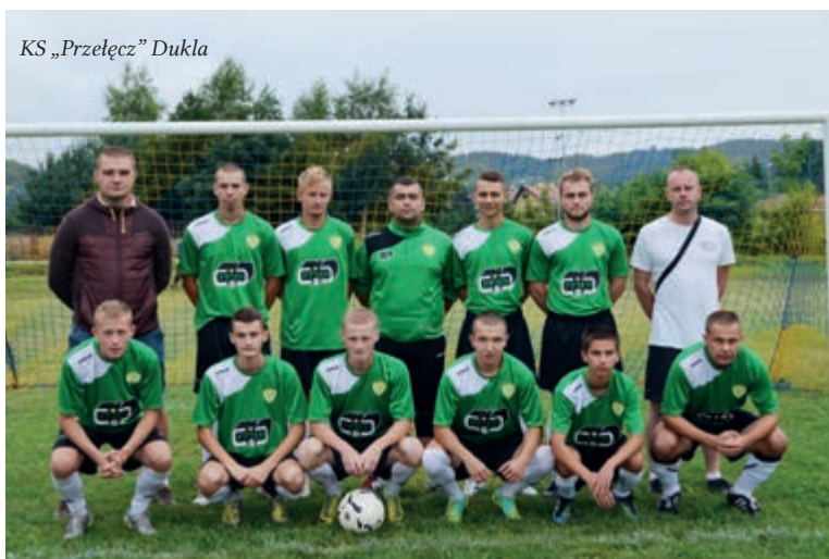
KS „Przełęcz” Dukla