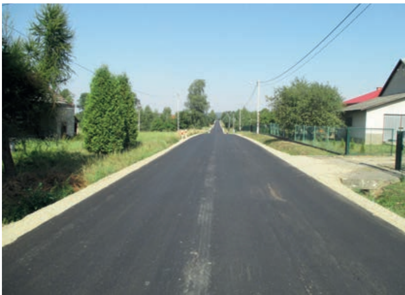
Wyremontowana droga Kobyle – Bratkówka – Odrzykoń