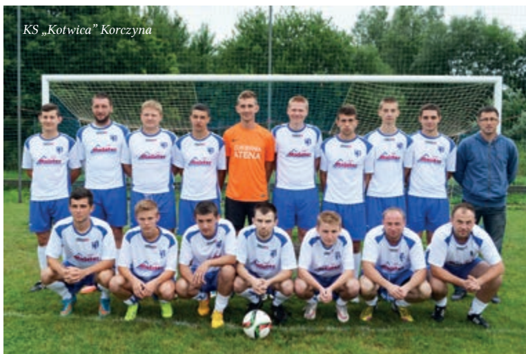
KS „Kotwica” Korczyna