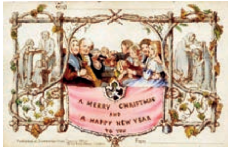
▲ Kartka bożonarodzeniowa 1849 obiegowa

Choinka – symbol nadziei, życia – przystrojona różnymi, mającymi swoje znaczenie ozdobami, to nieodłączny atrybut obchodów Świąt Bożego Narodzenia. Ojczyzną choinki była najprawdopodobniej Alzacja, a zwyczaj jej ubierania pochodzi z Niemiec. W Polsce przed pojawieniem się choinek (XIX w.) domy dekorowano „podłaźniczką” (podłaźniczką), małą sosną lub świerkiem zawieszaną u sufitu czubkiem ku dołowi, ozdabianą jabłkami, złożonymi orzechami, wycinankami. Zwyczaj ten miał zapewnić ludziom, domostwu i całemu dobytкови szczęście i wszelką pomyślność.