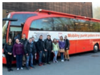
Życie z życia – przeszczep to nowe życie! – strona 6