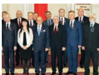
Zasłużony dla smorządu terytorialnego – strona 16