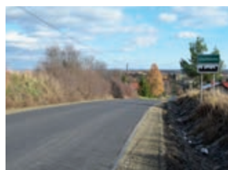
Inwestycje drogowe w powiecie – strona 8