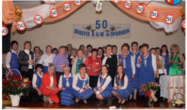
KGW w Korczynie-Spornem