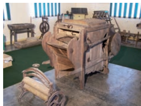
Muzeum Wsi w Odrzykoniu

Kościół parafialny pw. św. Jana Kantego w Ustrobniej to budowla w stylu neogotyckim, murowana, pochodząca z 1877 r. Wybudowana została według projektu Teofila Żebrowskiego. W ołtarzu głównym znajduje się rzeźbiona grupa Pasji z przełomu XIX i XX w., krucyfiks wykonany w Monachium, rzeźba Matki Boskiej i św. Jana Ewangelisty, wykonane przez krakowskiego rzeźbiarza Franciszka Wyspiańskiego.