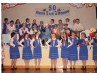
Złoty Jubileusz KGW w Korczyni-Spornem – strona 15