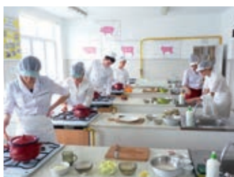
Konkurs w Gastronomiku – strona 16