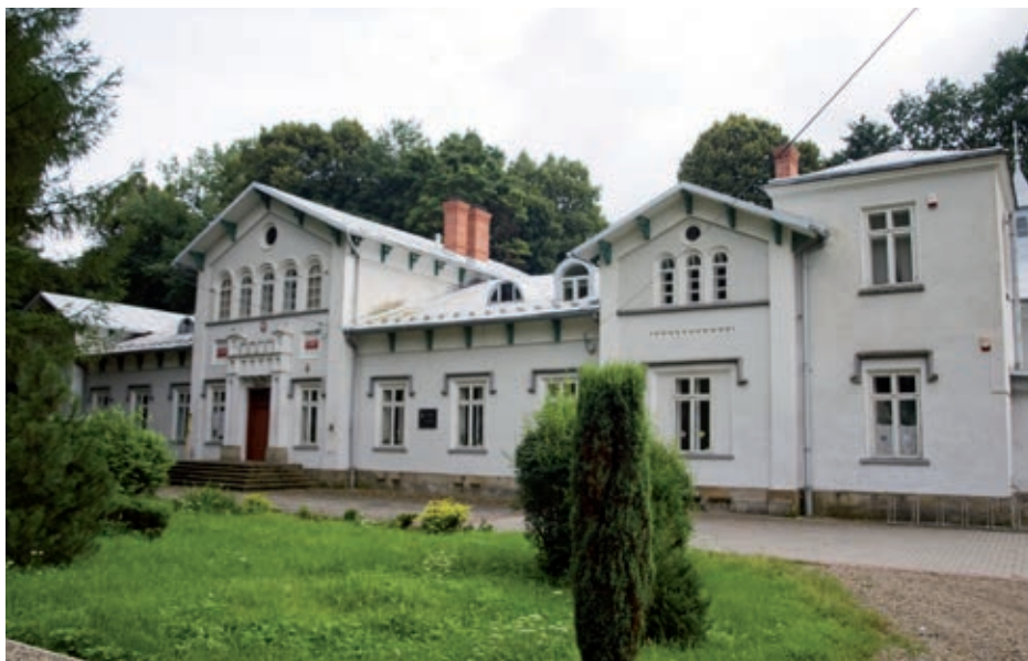
Dwór w Bratkowce

W Łączkach Jagiellońskich znajduje się kościół parafialny pw. Narodzenia Najświętszej Marii Panny i św. Andrzeja Apostoła . Jest to jeden z piękniejszych w regionie przykładów budownictwa barokowe-