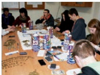
23 Finał WOŚP w Jedliczu – strona 11