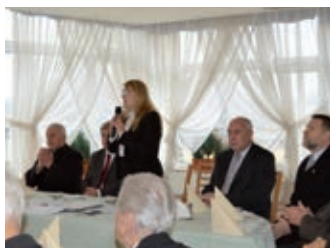
Spotkanie opłatkowe żołnierzy AK – strona 6