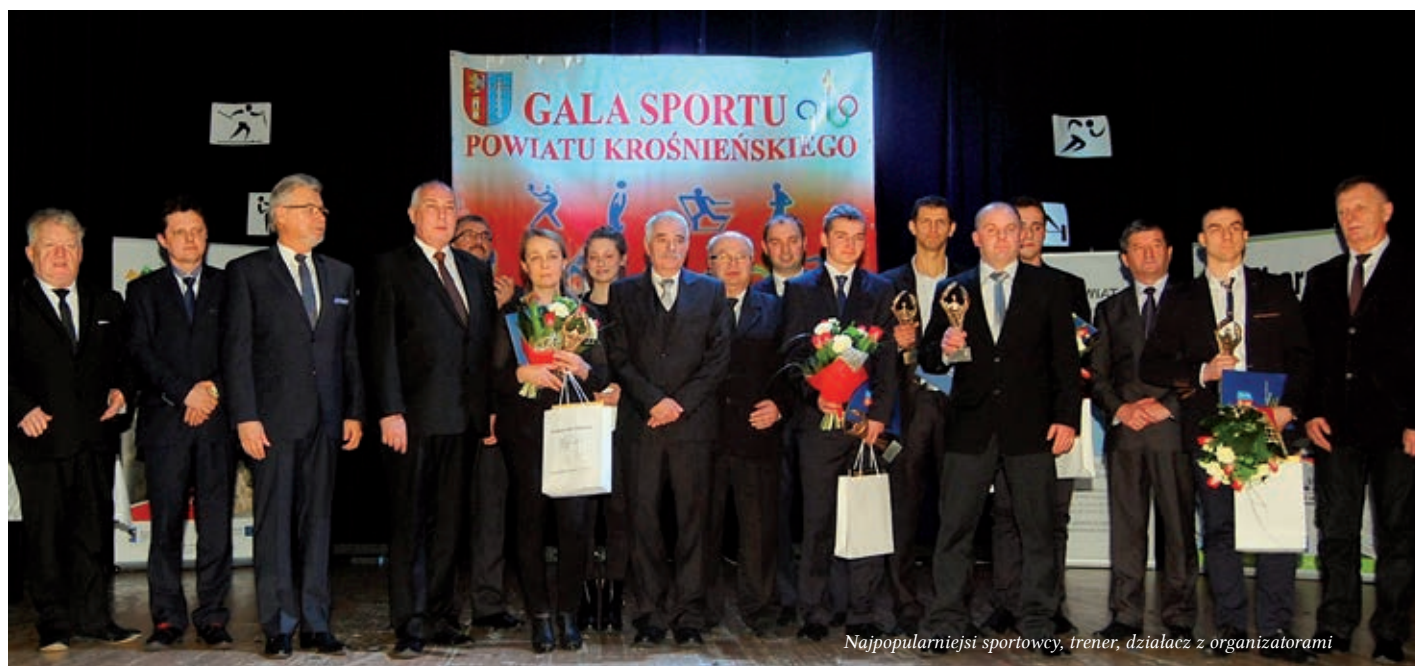
Najpopularniejsi sportowcy, trener, działacz z organizatorami