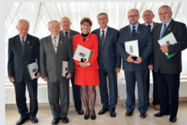
Odnaczeni „Za Zasługi dla Związku Sybiraków”