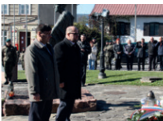
Rocznica w „Dolinie Śmierci” – strona 15