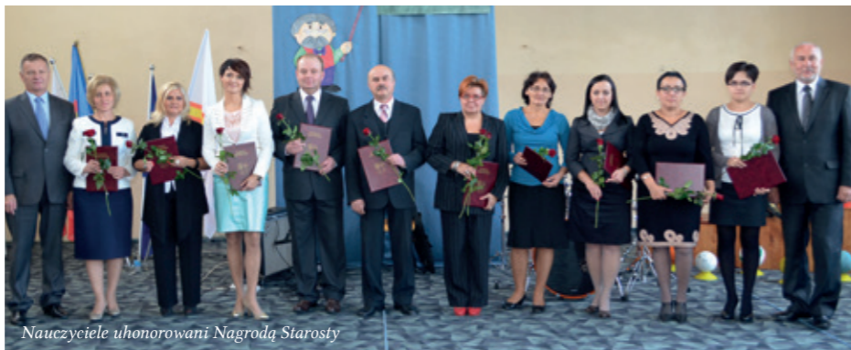
Nauczyciele uhonorowani Nagrodą Starosty