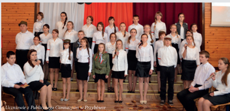
Uczniowie z Publicznego Gimnazjum w Przybówce