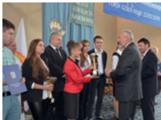
Powiatowy dzień sportu – strona 9