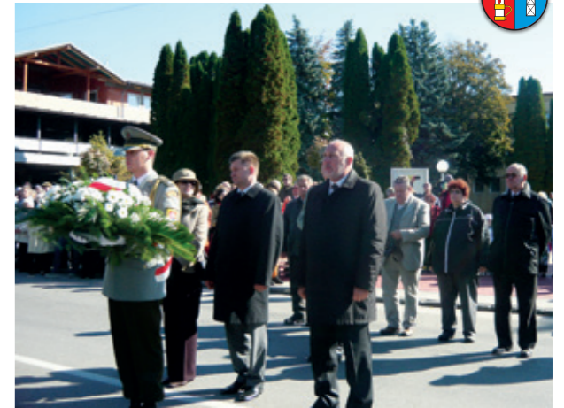
Uroczystości rocznicowe na Słowacji

Dzień później, 5 października obchody bitwy zwanej też karpacko-preszowską odbyły się w Świdniku na Słowacji. W uroczystościach uczestniczyła