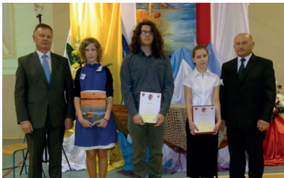
Kategoria szkoły ponadgimnazjalne