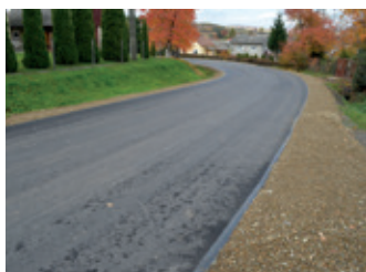
Inwestycje drogowe w powiecie – strona 7