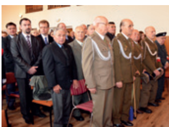
Pamiętamy i obiecujemy pamiętać – strona 16