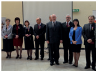
Jubileusz powiatu krosnieńskiego – strona 8