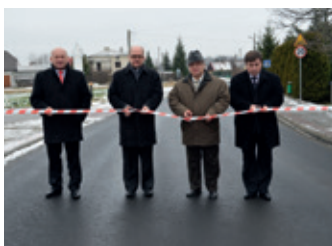
Ul. Południowa po remoncie – strona 7