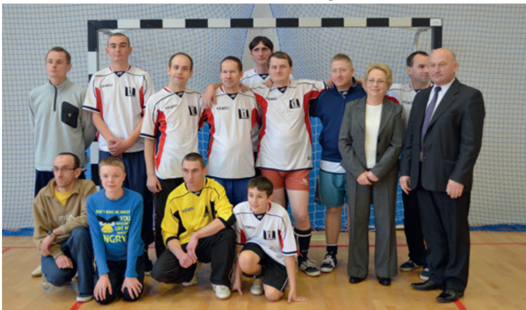
Mikołajkowy Turniej Niepełnosprawnych