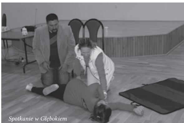
Spotkanie w Głębokiem

S TAROSTWO POWIATOWE W KROŚNIE W 2013 R. PRZEPROWADZIŁO CYKL SPOTKAŃ POŚWIĘCONYCH PROFILAKTYCE I PROMOCJI ZDROWIA. AKCJA PROWADZONA JEST W RAMACH PRZYJĘTEGO DO REALIZACJI PRZEZ ZARZĄD POWIATU PLANU EDUKACJI ZDROWOTNEJ W POWIECIE KROŚNIEŃSKIM.