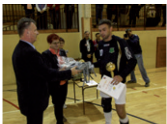
Turniej o Puchar Przewodniczącego – strona 10