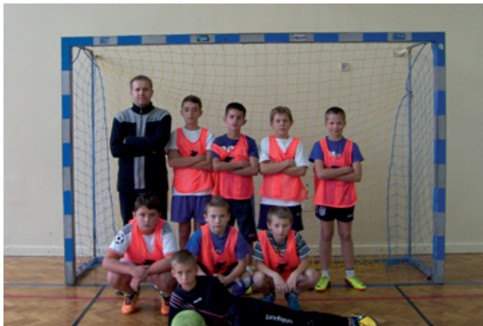
I m. SP w Targowiskach