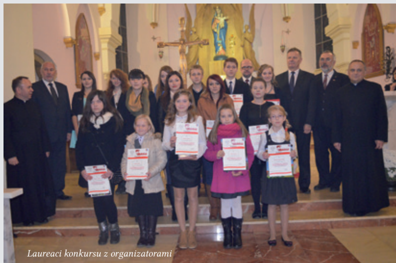
Laureaci konkursu z organizatorami

W DNIU 11 LISTOPADA 1918 ROKU ODRODZIŁA SIĘ NIEPODLEGŁA POLSKA I PO LATACH ZABORÓW POWRÓCIŁA NA MAPĘ EUROPY.