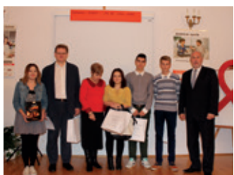
Powiatowy konkurs „Nie daj szansy AIDS” – strona 15