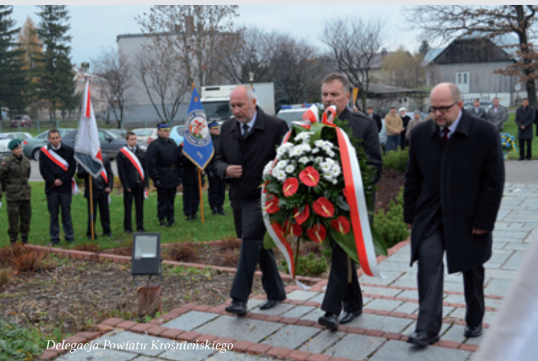
Delegacja Powiatu Krośnieńskiego