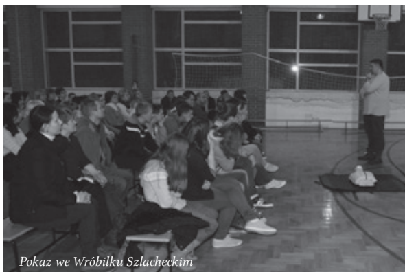
Pokaz we Wróbilku Szlacheckim