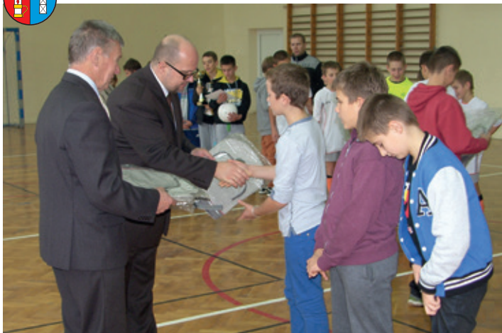
Turniej w Korczynie