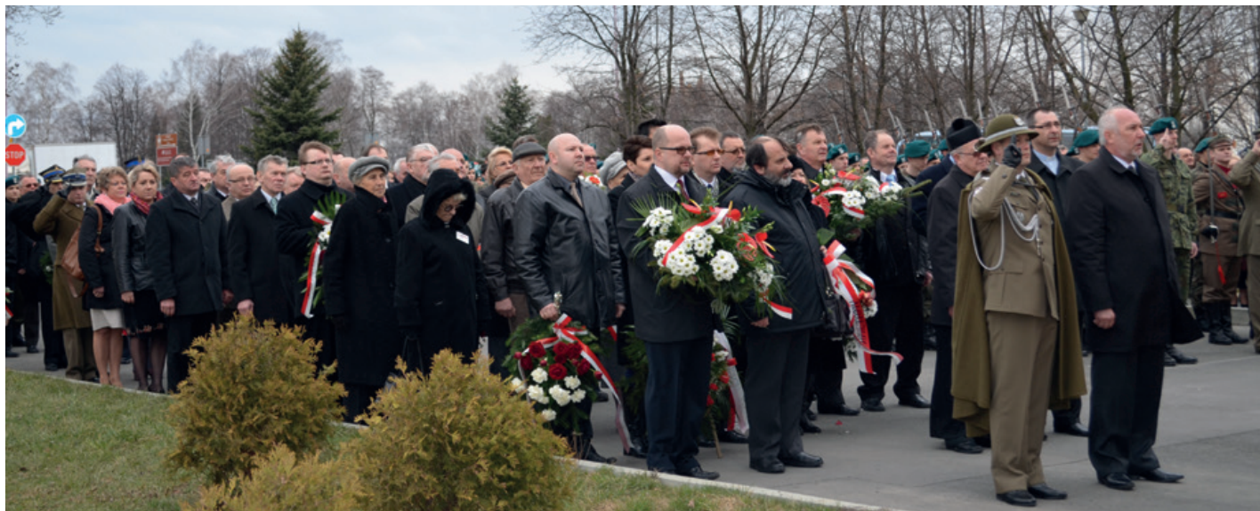
Uczestnicy uroczystości oddali hołd i złożyli kwiaty pod pomnikiem Ofiar Katynia

73. ROCZNICA ZBRODNI KATYŃSKIEJ, 3. ROCZNICA KATASTROFY SMOLEŃSKIEJ I 70. ROCZNICA LUDOBÓJSTWA NA WOŁYNIU, ZGROMADZIŁY 12 KWIECIA 2013 R. POD POMNIKIEM OFIAR KATYNIA PRZED BUDYNKIEM STAROSTWA POWIATOWEGO W KROŚNIE PARLAMENTARZYSTÓW, WŁADZE POWIATU KROŚŃIEŃSKIEGO, MIASTA KROSNA, RADNYCH, WÓJTÓW, BURMISTRZÓW, KSIĘŻY, DELEGACJE XVII DZIELNICY BUDAPESZTU, SŁUŻBY MUNDUROWE, WOJSKA, STRAŻY POŻARNEJ, STRAŻY GRANICZNEJ, PRZEDSTAWICIELI NSZZ „SOLIDARNOŚĆ”, ZWIĄZKU SYBIRAKÓW, AK, ŻOŁNIERZY WP, KOMBATANTÓW, DYREKTORÓW SZKÓŁ I JEDNOSTEK ORGANIZACYJNYCH, MŁODZIEŻ ORAZ MIESZKAŃCÓW.