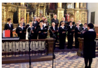
Koncert Wielkanocny w Rymanowie – strona 16