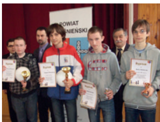
I turniej juniorski w szachach szybkich – strona 10