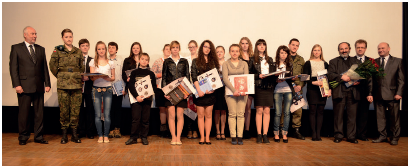
Laureaci konkursu Polskiej Poezji Sybirackiej wraz z organizatorami i zaproszonymi gośćmi