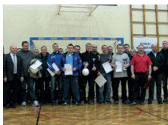
Halowy Turniej o Puchar Starosty – strona 15

Zaproszenie na Powiatowy Piknik Artystyczny – strona 13