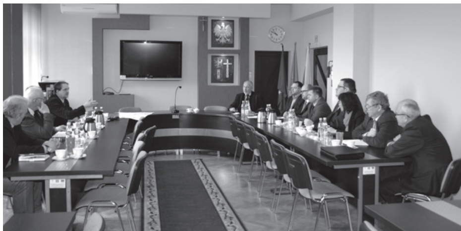
Spotkanie robocze w Starostwie Powiatowym w Krośnie

Centrum Powiadamiania Ratunkowego będzie mieć siedzibę w Rzeszowie. Celem tej komórki będzie odbieranie zgłoszeń z całego województwa przez operatora numerów alarmowych i przekazywanie go do właściwej dyspozytorni. Pozwoli to precyzyjnie wskazać miejsce zdarzenia i skierować tam odpowiednie służby