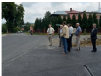
Inwestycje drogowe w powiecie – strona 8