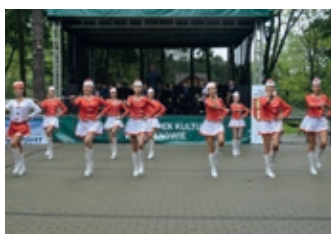
Rymanowskie spotkania orkiestr dętych – strona 13