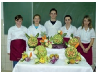
Powiat stawia na zawodowców – strona 4