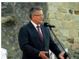
Prezydent RP na ziemi krosnieńskiej – strona 16