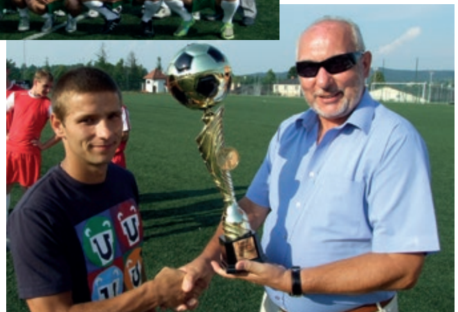
Starosta wręcza puchar dla zwycięskiej drużyny

B-C (GLKS „Karpaty” Klimkówka – KKS „Dwór” Kombornia) – 1:0