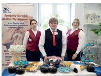
VIII dukielskie dni świadomości autyzmu – strona 14