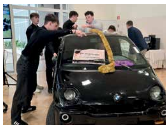
Pożegnanie maturzystów w Zespole Szkół w Iwoniczu – strona 4