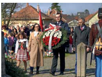
Delegacja Powiatu Krosnieńskiego w Budapeszcie – strona 15