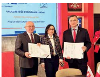
„Echa historii: Bitwa Karpacko-Dukielska” – strona 3