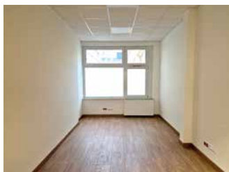
Duże zmiany w budynku Starostwa. Końcowy etap realizacji – strona 4