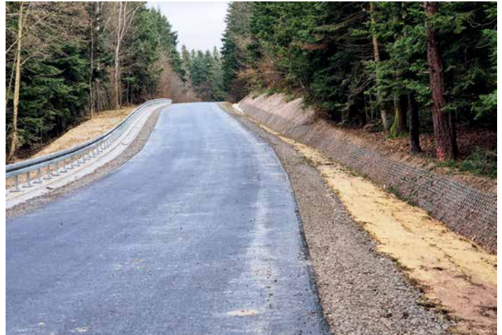
Droga przed i po przebudowie

P OWIAT KROŚNIEŃSKI ZAKOŃCZYŁ PRACE ZWIĄZANE ZE STABILIZACJĄ OSUWISKA ORAZ ODBUDOWĄ DROGI POWIATOWEJ NR 1940R PRZYBÓWKA – PIETRUSZA WOLA – RZEPNIK – BRATKÓWKA W MIEJSCOWOŚCI BRATKÓWKA. DZIĘKI INWESTYCJI KIEROWCY MOGĄ JUŻ BEZPIECZNIE KORZYSTAĆ Z W PEŁNI ODTWORZONEGO ODCINKA DROGI.