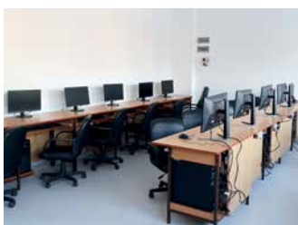
Dostosowanie pracowni ZS w Jedliczu dla osób niepełnosprawnych – strona 11