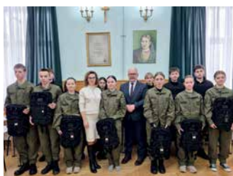
Mundury i sprzęt dla klasy mundurowej w LO w Jedliczu – strona 10