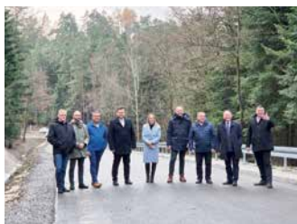
Koniec prac przy stabilizacji osuwiska w Bratkówce – strona 3