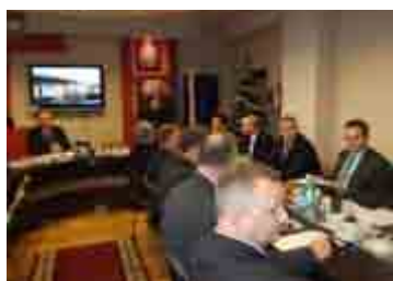
Spotkanie ws. budowy drogi S-19 - str. 5