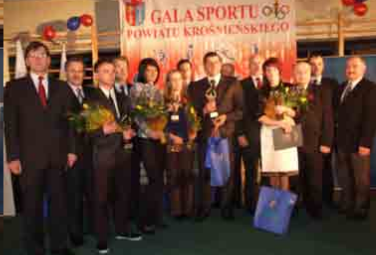
Najlepsi sportowcy wybrani przez Kapitułę