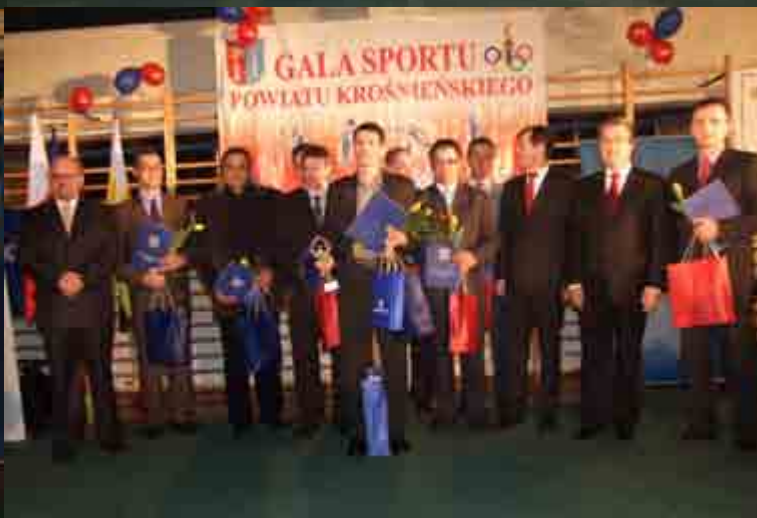
Trenerzy nominowani do plebiscytu z organizatorami