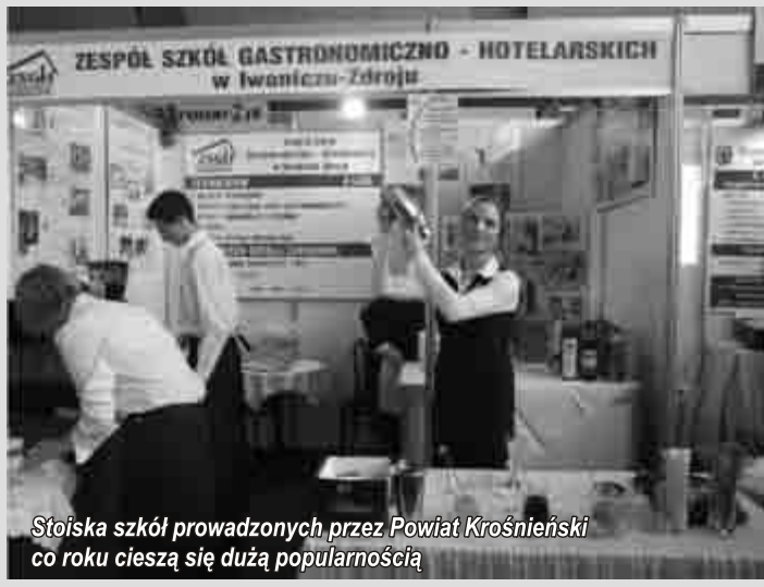
Stoiska szkół prowadzonych przez Powiat Krosnieński co roku cieszą się dużą popularnością

Współorganizatorem Targów, podobnie jak w latach ubiegłych, jest Starostwo Powiatowe w Krośnie. Targi odbędą się w hali widowiskowo sportowej przy ulicy Bursaki w Krośnie.