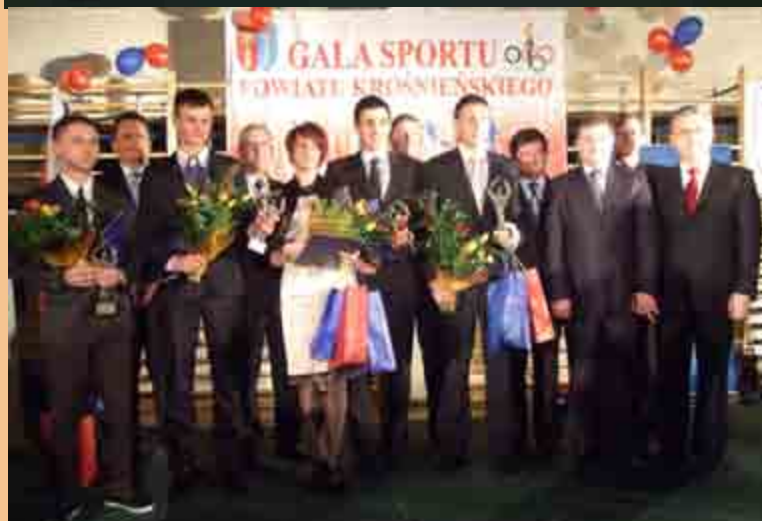
Najpopularniejsi sportowcy z wójtami i burmistrzami