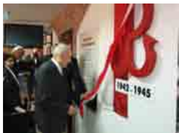
Dzień Patrona w ZS w Jedliczu - str. 2