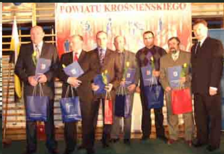
Przewodniczący Rady Powiatu z działaczami nominowanymi do plebiscytu