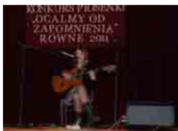
Konkurs piosenki w Równem - str. 7