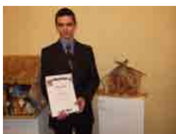
Międzynarodowy konkurs szopek - str. 10